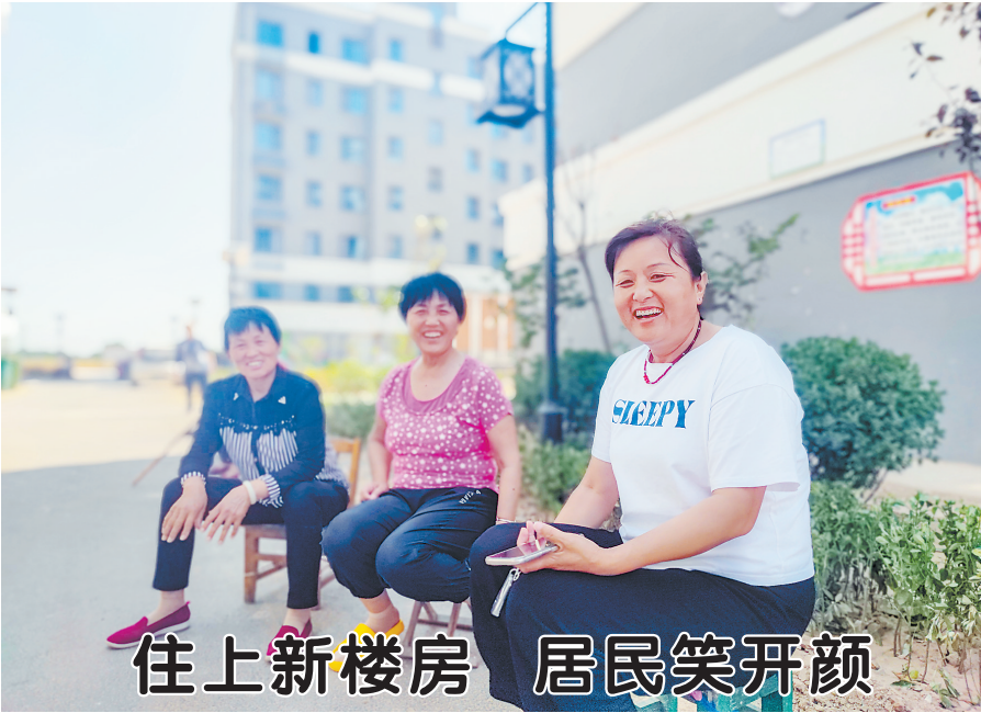
住上新楼房 居民笑开颜

“有电梯，老人不用再担心上楼了。”“家家通天然气，年底还有可能通暖气，标准大提升。”“小区很干净，健身器材、儿童游乐区、读书室等公共区域应有尽有。”……近日，走进成武县党集镇凤凰社区，一幢幢高楼拔地而起，道路干净整洁，小区绿意盎然，居民乘凉时谈起新家，高兴得合不拢嘴，感觉像住在城市里一样。 据了解，该社区为郭楼、刘海行政村安置区，总建筑面积10万平方米，共建设18栋“6+1”全电梯楼房，可安置群众684户。目前，建设已全部完成，530户回迁群众已全部结算交房，群众对未来的生活充满信心，满意度、幸福感、获得感进一步提升。