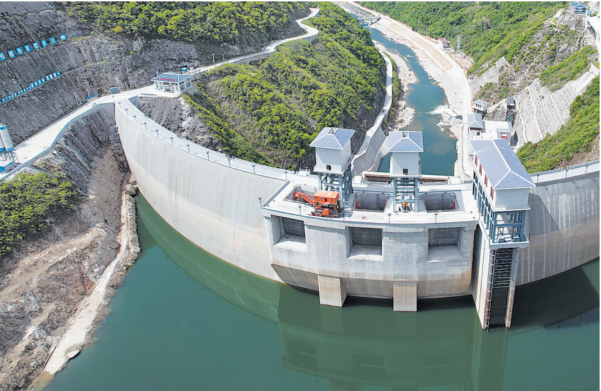
引汉济渭工程三河口水利枢纽工程(2022年4月19日摄,无人机照片)。

投资,是拉动经济的“三驾马车”之一。今年以来,稳投资加码发力,固定资产投资规模持续扩大,新基建蕴含新机遇,一项项重大工程抓紧推进,投资关键作用进一步发挥,为推动经济行稳致远注入持久动力。