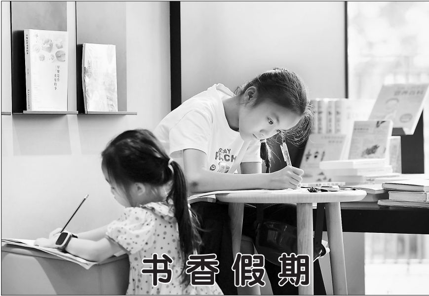
7月14日，在南宁市一家新华书店，两名学生在学习。 进入暑假，广西南宁市不少学生来到书店阅读，享受书香假期。

新华社南京7月14日电 2022年7月14日，南京市中级人民法院一审公开开庭审理了山东省人大常委会原党组成员、副主任张新起受贿一案。 南京市人民检察院起诉指控：2001年至2019年，被告人张新起利用担任中共潍坊市委副书记、潍坊市人民政府副市长、市长，中共潍坊市委书记，中共青岛市委副书记、青岛市人民政府市长，山东省人大常委会副主任等职务上的便利，为相关企业和个人在企业经营、项目开发、工程承接、规划