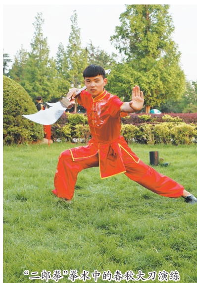
“二郎拳”拳术中的春秋大刀演练