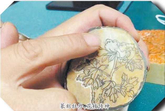
篆刻牡丹,花枝传神