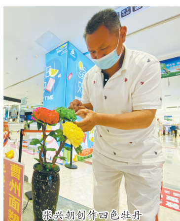
张兴朝创作四色牡丹