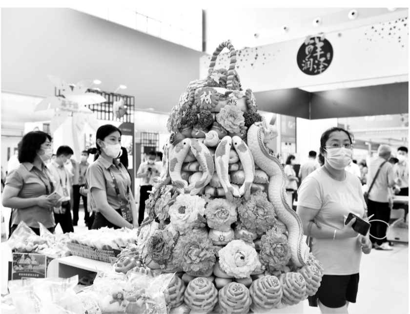
►8月5日,第二届韩国(山东)进口商品博览会在山东省威海市举行。本届博览会以“行稳致远·共创未来”为主题,设置了“中韩建交30周年”“一带一路及上合组织”“RCEP区域”“千里山海”等主题展区,吸引来自全球20多个国家和地区的客商参展。新华社发

中消协将对月饼过度包装开展消费监督 新华社北京8月5日电 (记者赵文君)为进一步遏制月饼过度包装现象,中国消费者协会与中国焙烤食品糖制品工业协会将在今年中秋节前联合对月饼过度包装开展消费监督。 这是记者5日从中消协获悉的。此次消费监督工作将参考新修订的《限制商品过度包装要求 食品和化妆品》强制性国家标准。考虑到新标准将于2023年9月1日正式实施,企业 and 市场还存在标准过渡期,监督工作将兼顾过渡期“双标并行”。 今年中消协联合国内14家主要行业协会向广大经营者与消费者发出“反对商品过度包装 践行简约适度理念”的倡议。中消协有关负责人建议,企业要按照有关法律法规和新标准的要求,严格落实企业主体责任。消费者要自觉践行绿色消费理念,不选购、不使用过度包装的商品。