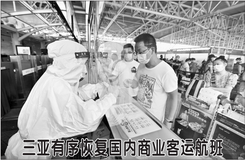
8月15日,乘客在三亚凤凰国际机场办理登机手续。当日,记者从三亚市委宣传部获悉,自8月15日零时起,三亚凤凰国际机场有序恢复国内客运航班商业化运行。

经济主要指标保持恢复态势——7月份,全国规模以上工业增加值同比增长3.8%;全国服务业生产指数同比增长0.6%。社会消费品零售总额同比增长2.7%,全国固定资产投资(不含农户)环比增长0.16%,货物进出口总额同比增长