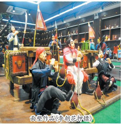
面塑作品《李朝花押镖》