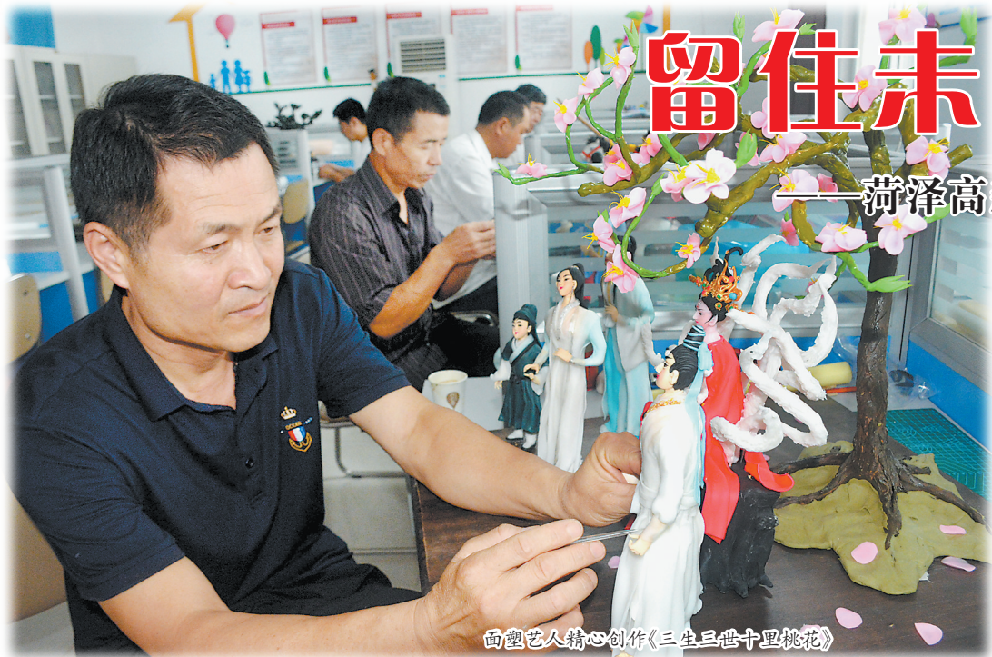
面塑艺人精心创作《三生三世十里桃花》