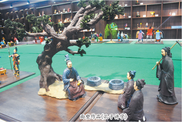
面塑作品《孔子讲学》