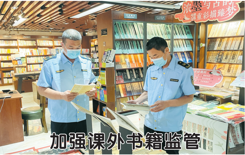
加强课外书籍监管

为保障群众获得高质量、有效率、能负担的缺牙修复服务,国家医疗保障局18日发布《关于开展口腔种植医疗服务收费和耗材价格专项治理的通知(征求意见稿)》,向社会公开征求意见。 征求意见稿共四部分12条,重点是规范口腔种植收费方式、做好口腔种植等医疗服务价格调控、开展种植牙耗材集中采购、实施口腔种植收费综合治理等,促进口腔种植的健康有序发展。