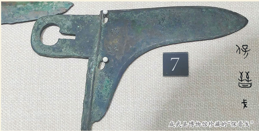
成武县博物馆珍藏的“保晋戈”

到公元前493年,赵鞅在外援的帮助下,击败范氏、中行氏,两人逃入朝歌(今河南淇县)。赵鞅在友军支持下,率晋军包围朝歌,而齐、鲁、宋、卫、郑、鲜虞等国则支持范、中行二氏。齐国向朝歌运输粮食,并由郑大夫子姚、子般领兵护送,范氏出城迎粮。赵鞅知道后,领兵前去截击。与郑军在铁丘(今濮阳西北)展开激战。当时郑军势众,赵鞅的兵力