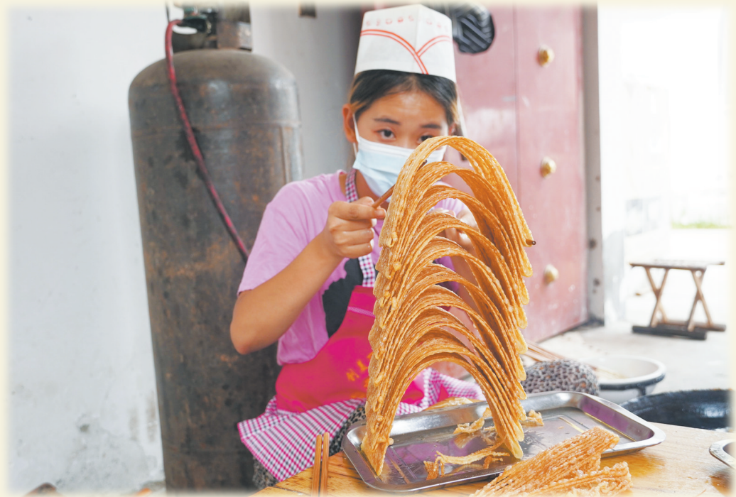
▲刚炸出锅的馓子 ◀一根到底的面条 ▼家庭式馓子作坊