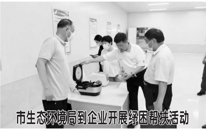
市生态环境局到企业开展纾困帮扶活动

此次行动8月18日至26日,以解决高风险食品、高风险指标、高风险区域等食品安全问题为重点,突出排查消除食品安全隐患,确保食用农产品安全为目标。对牡丹区银田农贸市场、开发区智慧冷链城等批发市场的所有商户进行全覆盖检查,对人民群众日常消费量较大、关注度高、风险程度高的食用农产品全覆盖抽检。