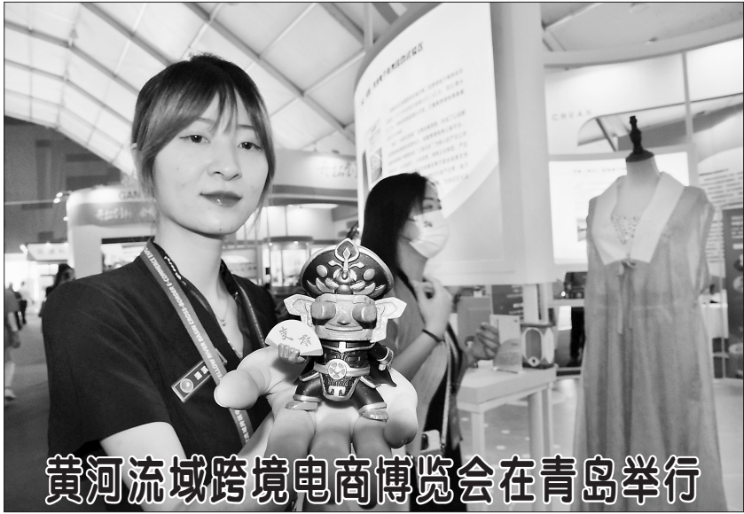
黄河流域跨境电商博览会在青岛举行

障群众饮水及农业灌溉用水等。安排农业抗旱保秋粮生产资金35亿元，主要用于支持受灾农户购买燃油、农药、种子等农业生产恢复所需物资；同时，对喷施叶面肥、调节剂、抗逆剂、杀菌杀虫剂等提高农作物抗旱性的混合药剂给予补助，防范旱情发展蔓延，保障秋粮稳产丰收。