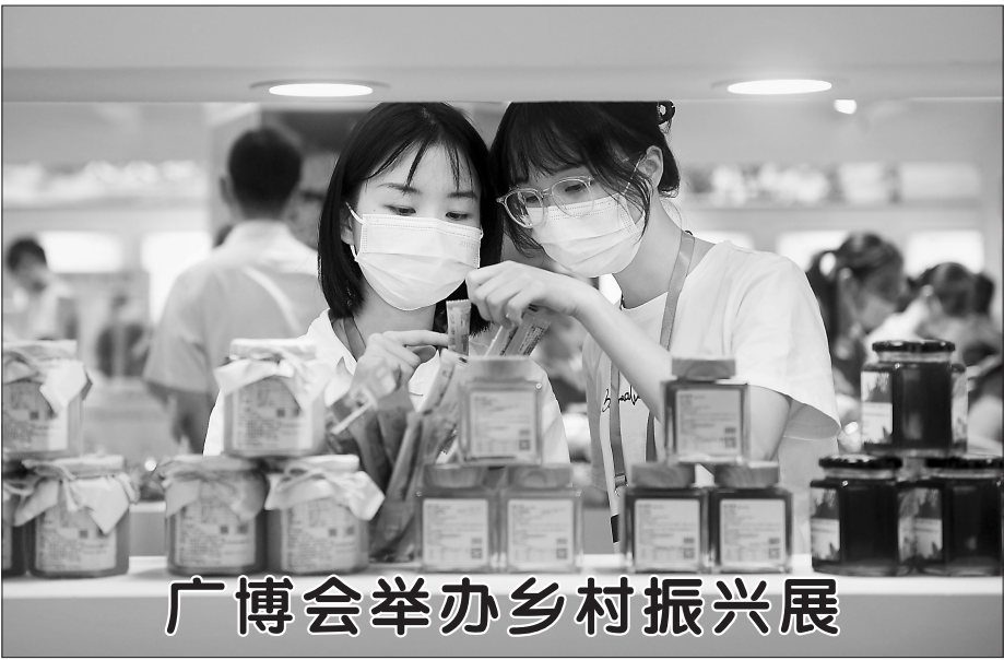
广博会举办乡村振兴展

21日赛后，河南嵩山龙门俱乐部就提前发布公告表示，将诚恳接受中国足协的一切处罚决定，并提出：“俱乐部将对对中国足协给予红牌处罚的球员作追罚处理。包括但不限于：罚款、停训、停赛、停薪、解