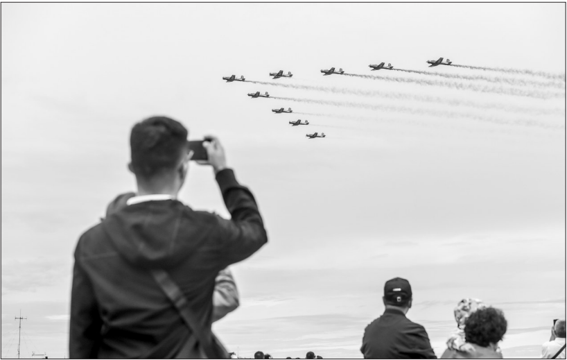
▲8月26日，在空军航空开放活动暨长春航空展上，空军航空大学“天之翼”飞行表演队进行飞行表演。

换成了歼-10，航迹从本场到飞遍国内再到飞出国门，成长历程也见证了人民空军的发展壮大。”