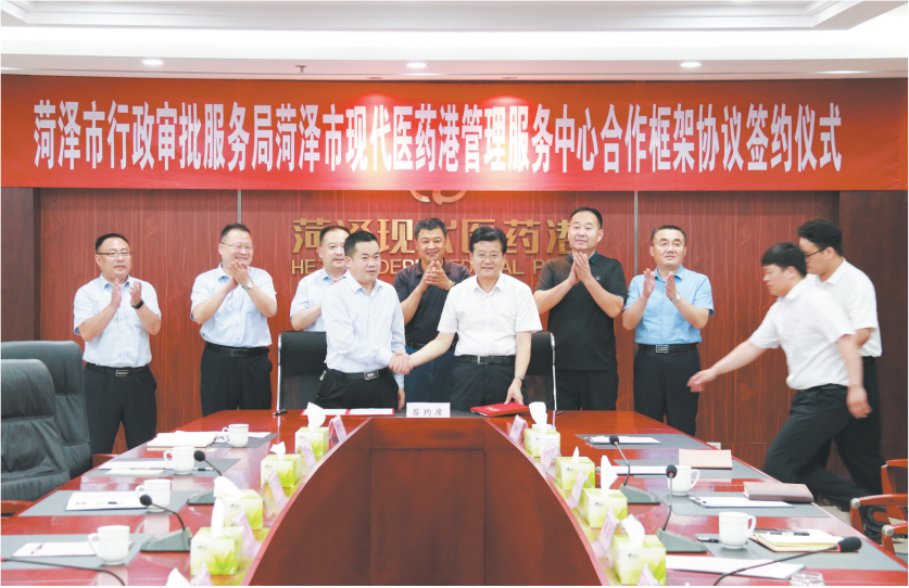
市行政审批服务局与市现代医药港合作共建