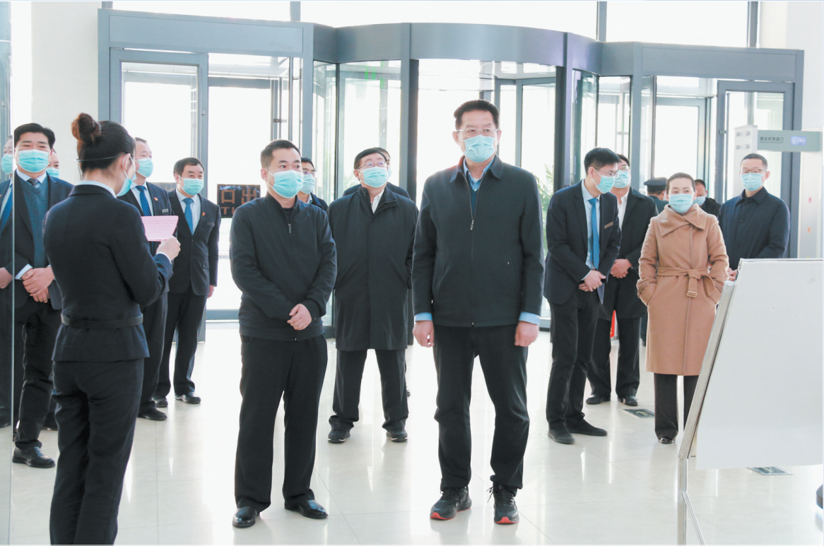
市委书记张新文到市行政审批服务局调研

好的营商环境就是生产力、竞争力。2018年12月,按照省委、省政府部署,在市委、市政府的坚强领导下,菏泽市行政审批服务局应改革而生,为政务服务注入新动能。运行近4年来,市行政审批服务局在改革的沃土中拔节成长,成为一个集行政审批、政务服务、信息公开、帮办代办等功能于一体的综合性服务平台。目前共承担从30个部门单位划转的行政权力事项214项,共有37个市直部门单位入驻市政政务服务大厅,开设服务窗口84个,可办理各类政务服务事项1373项。