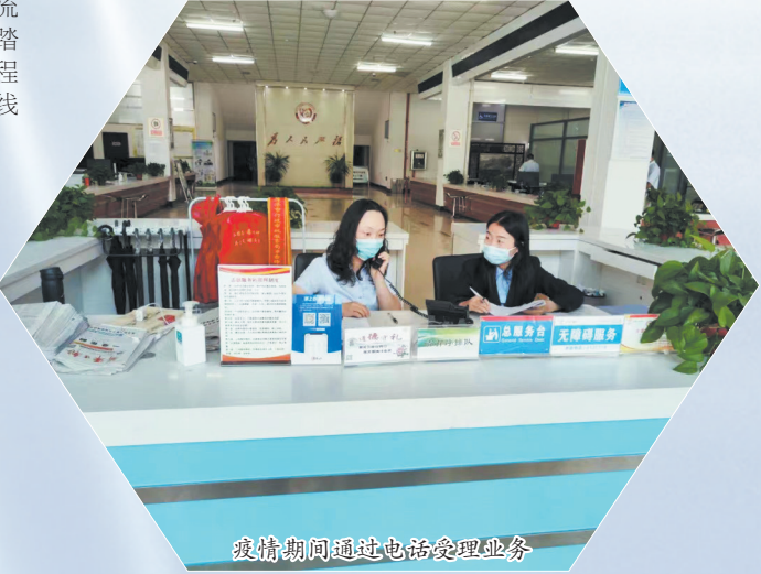
疫情期间通过电话受理业务