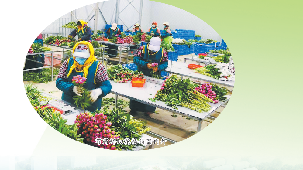
牡丹鲜切花畅销国内外