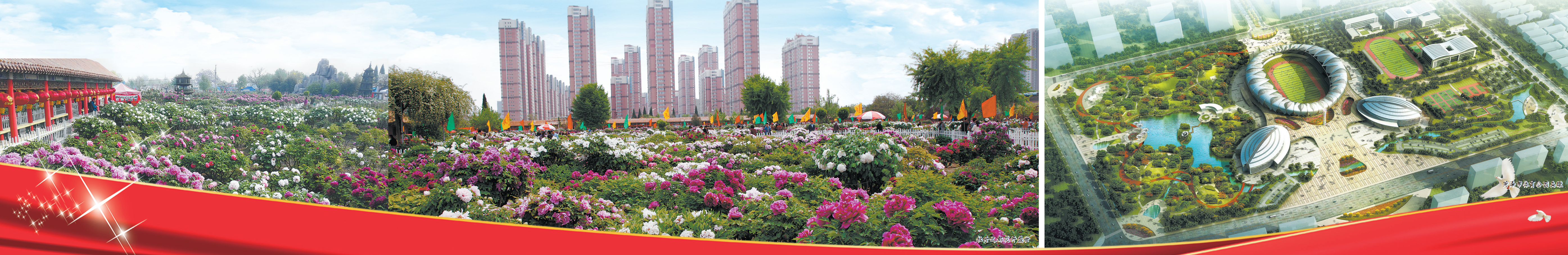
牡丹区融媒体中心