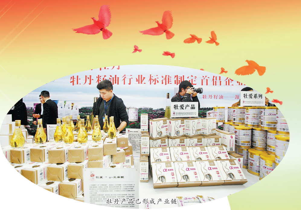
牡丹籽油行业标准制定首倡企业