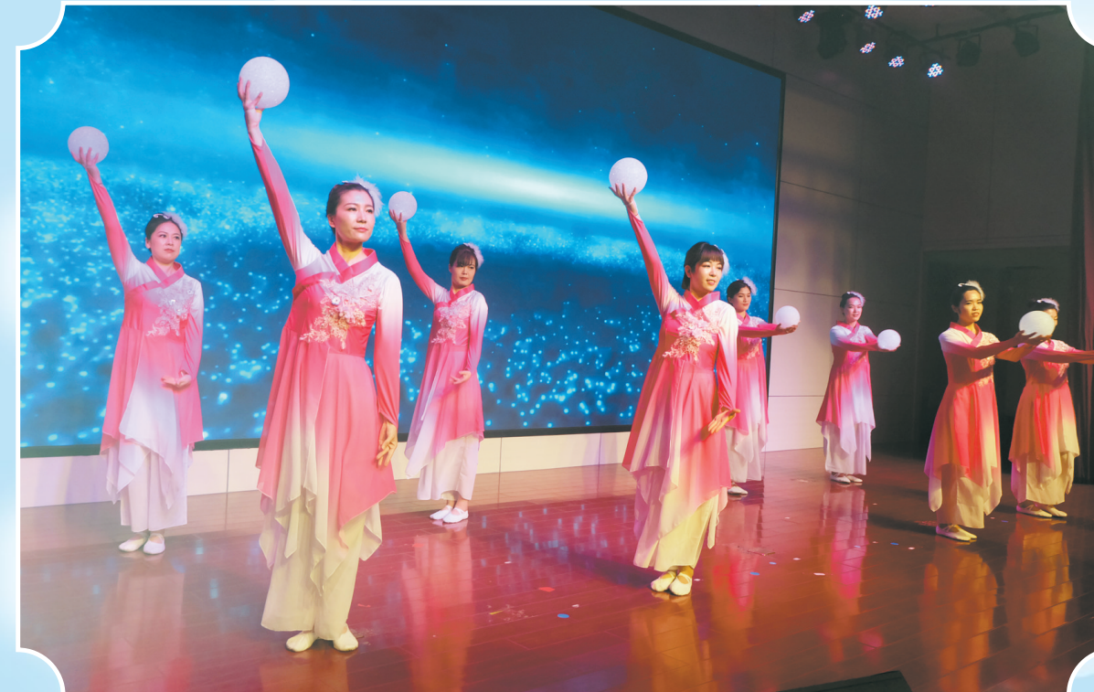
2021年护士节文艺晚会

在各行各业学习贯彻党的二十大精神之际,回顾单县中心医院近十年的发展历程,成绩令人鼓舞,目标催人奋进。