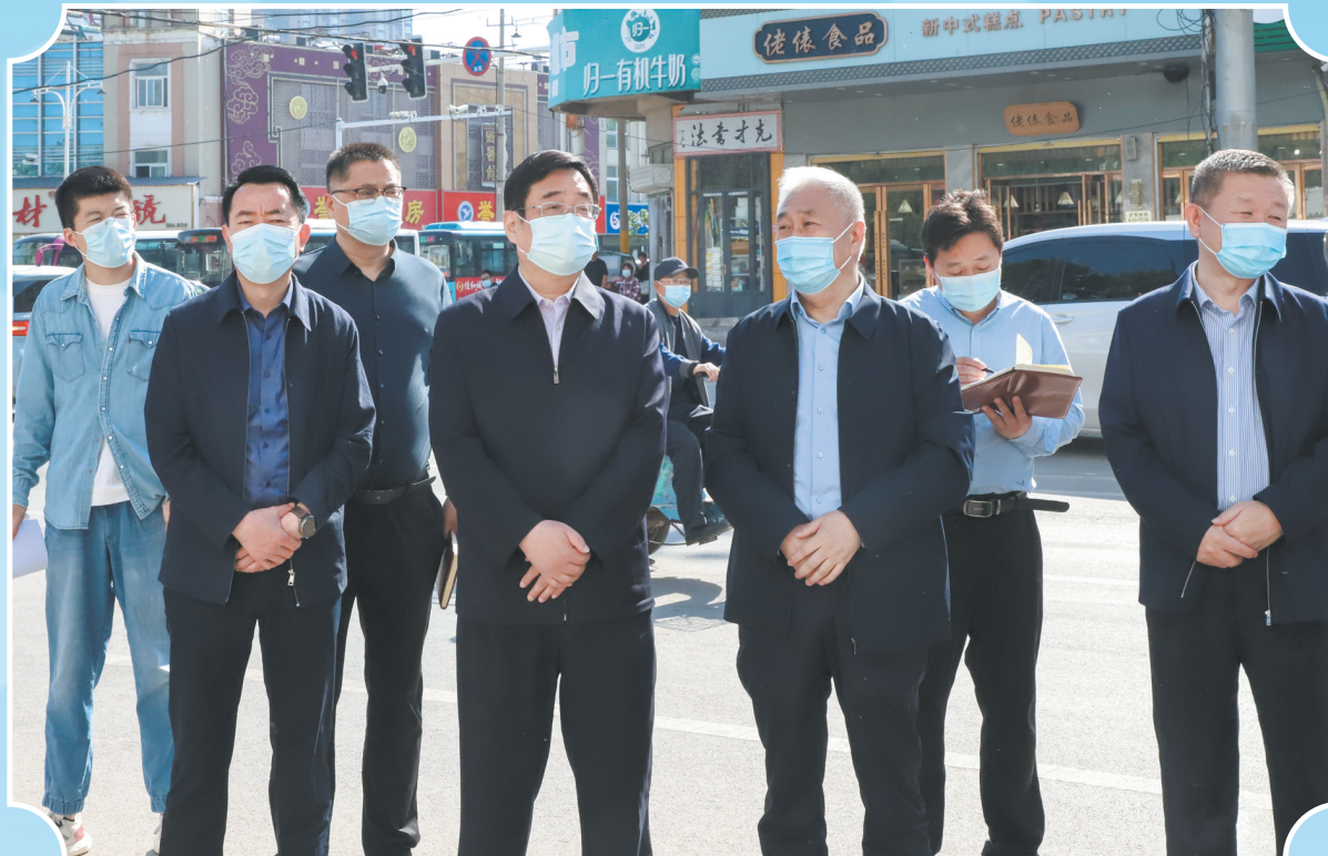
单县县委书记耿路华(左四)来医院调研疫情防控工作