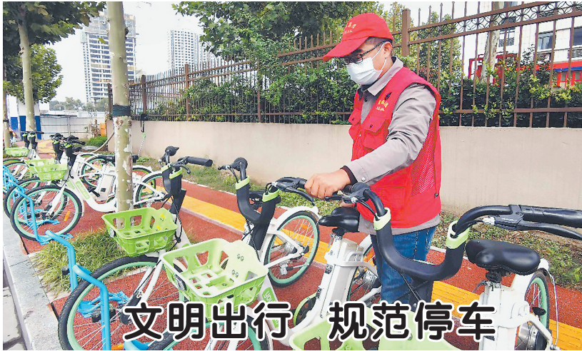
▲为进一步优化城区市容环境,规范非机动车辆停车秩序,打好创城攻坚战,近日,牡丹区积极组织新时代文明实践志愿者针对城区人行道非机动车辆乱停乱放的现象开展志愿服务。图为志愿者对人行道上无序停放的助力车进行规范入位、有序排列。