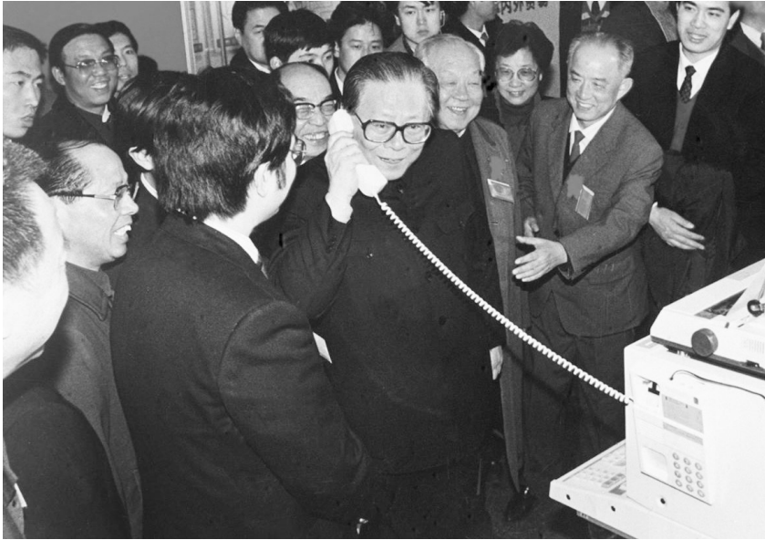
1984年5月,江泽民同志在北京展览馆举行的全国电子新产品展览会上,试用国际长途电话向远方的工作人员问候。