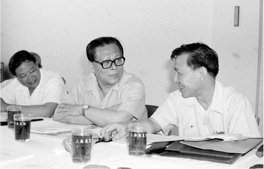
1985年,江泽民同志在上海市八届人大四次会议上。