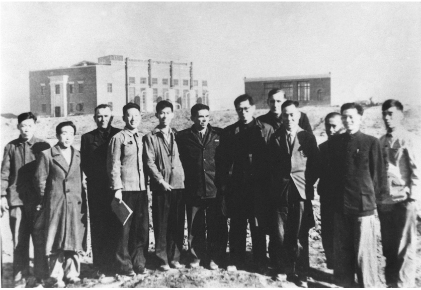
1956年,江泽民同志(左七)在长春第一汽车制造厂同援建一汽的苏联专家等合影。