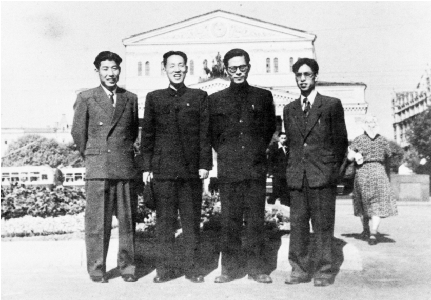
1955年至1956年,江泽民同志(右二)曾在莫斯科斯大林汽车制造厂实习。这是江泽民等在莫斯科合影。