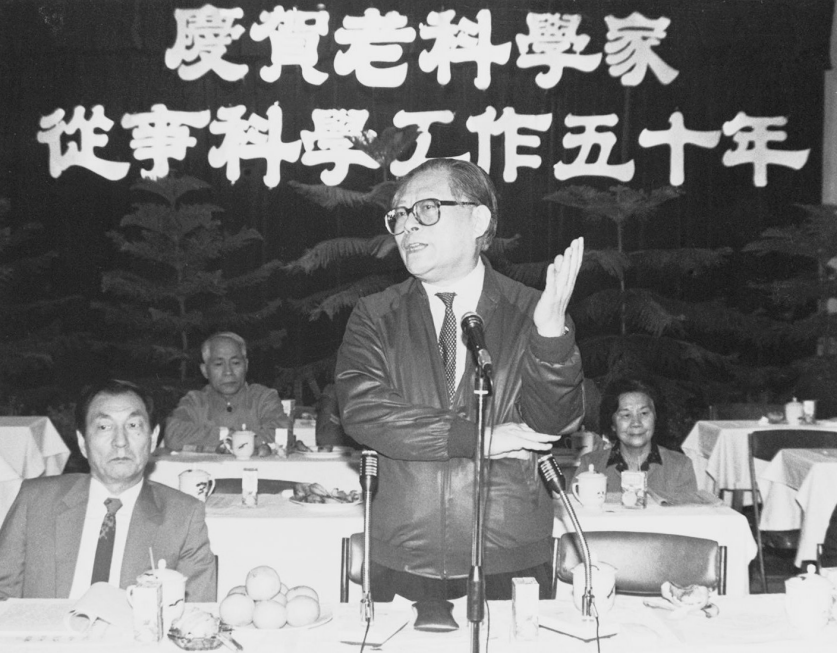
1988年10月,江泽民同志在上海庆祝老科学家从事科学工作五十年座谈会上讲话。