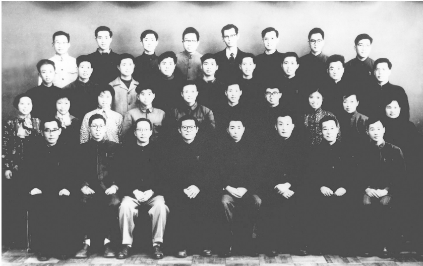
1963年3月,江泽民同志(前排右五)在上海同小型三相异步电机全国统一系列设计领导小组成员合影。