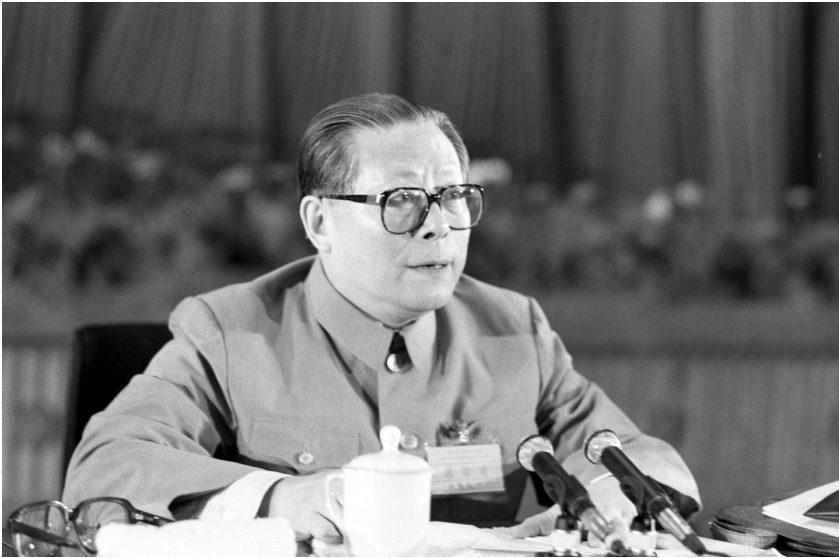
1989年6月23日至24日,中国共产党第十三届中央委员会第四次全体会议在北京召开。这是江泽民同志在会上讲话。