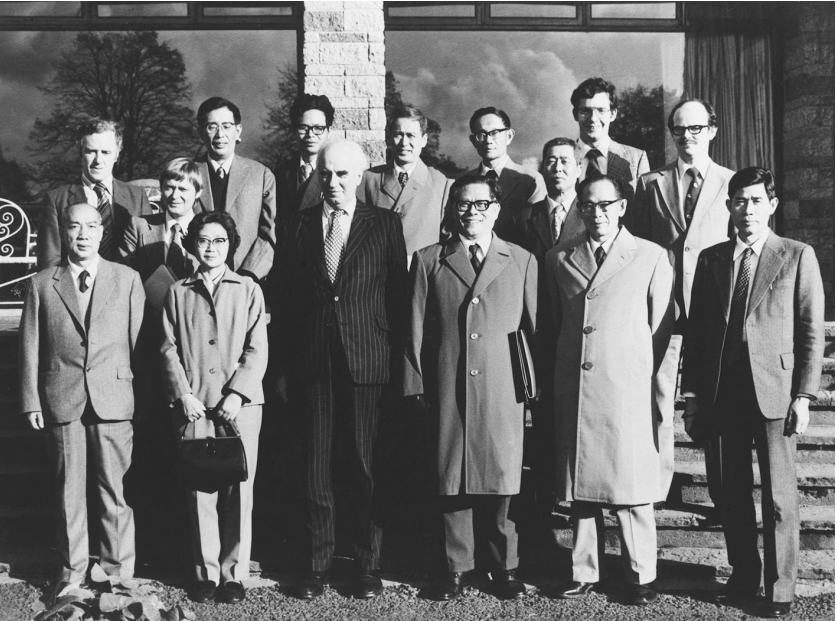
1980年10月底,江泽民同志(前排右三)在爱尔兰香农开发区考察时同开发区负责人等合影。