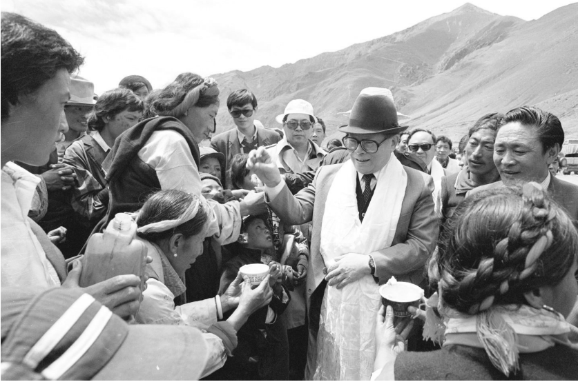
1990年7月25日,江泽民同志与藏族群众共庆望果节。