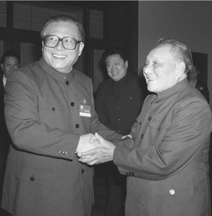
1989年11月6日至9日,中国共产党第十三届中央委员会第五次全体会议在北京召开。这是邓小平同志和江泽民同志亲切握手。