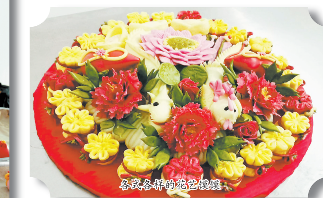
各式各样的花艺馍馍