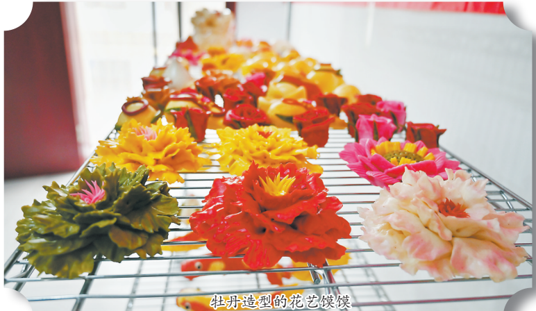
牡丹造型的花艺馍馍