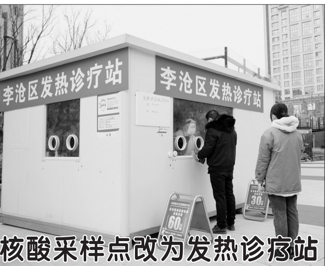
12月20日,市民在山东省青岛市李沧区一处发热门诊站排队就诊。近日,一些城市将部分核酸采样点改造为发热门诊站,为居民提供就诊、开药等一站式服务。