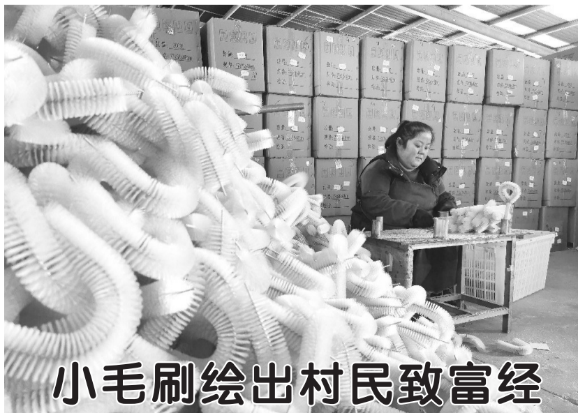
小毛刷绘出村民致富经

陈集镇通过流转土地,发展花卉产业,拓宽了产业发展途径,美丽经济带来好“钱”景。