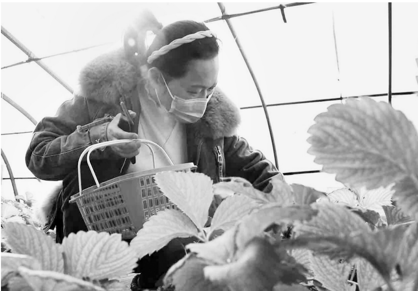
“这里的草莓比市面上其他的草莓都好吃,家里的孩子特别喜欢,而且价格还亲民。”近日,在东明县三春集镇春博园内的