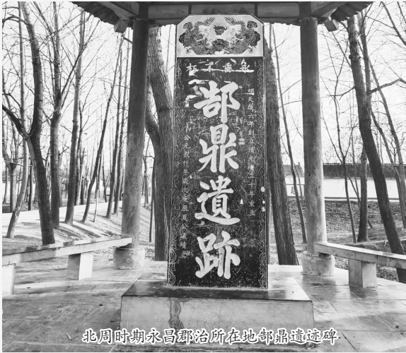
北周时期永昌郡治所在地部鼎遗址碑