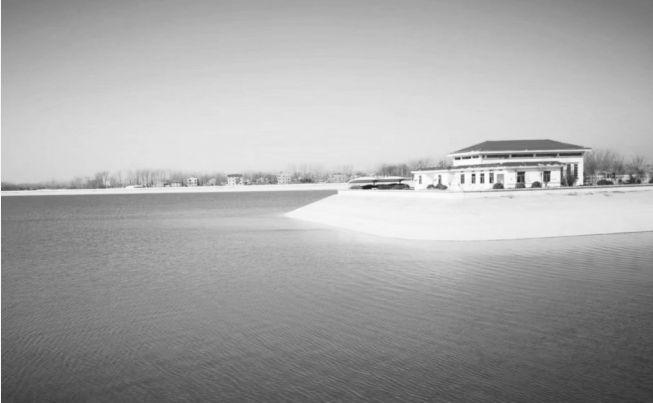
黑龙潭遗址修建的月亮湾水库