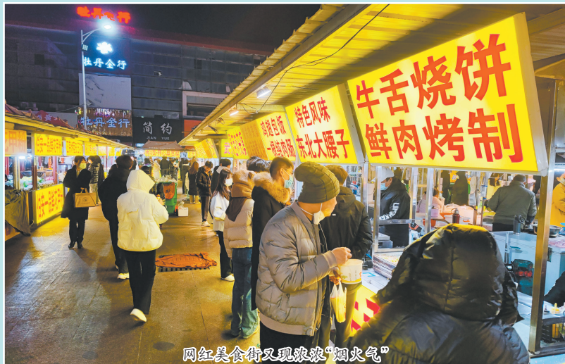
网红美食街又现浓浓“烟火气”