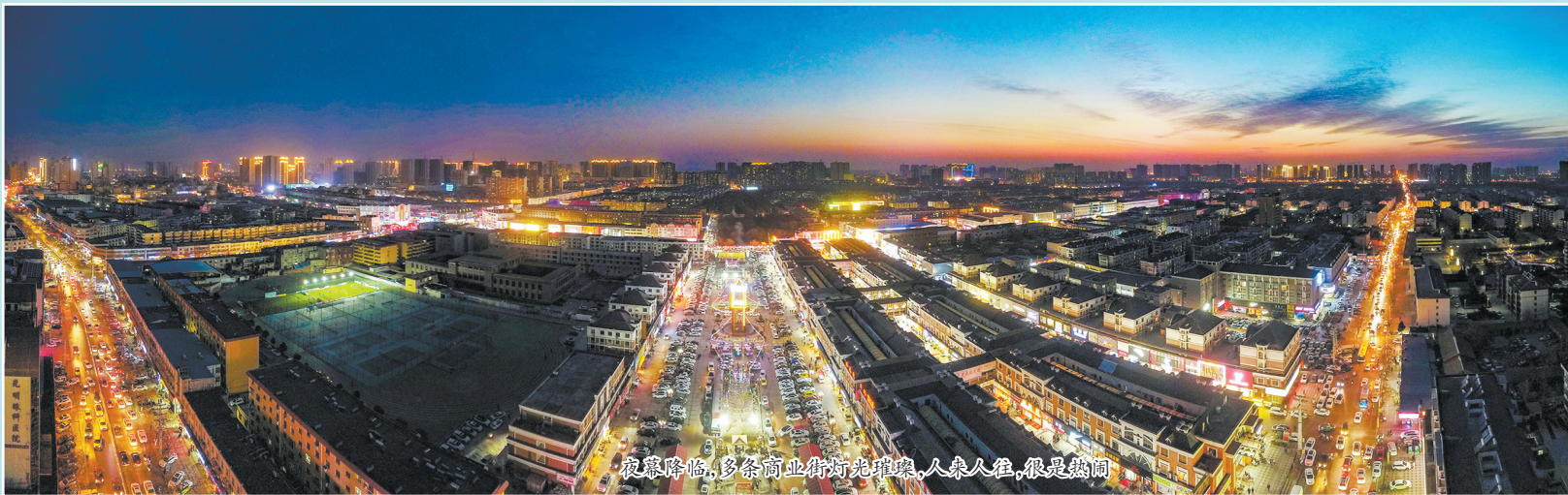
夜幕降临，多条商业街灯火璀璨，人山人海，很是热闹