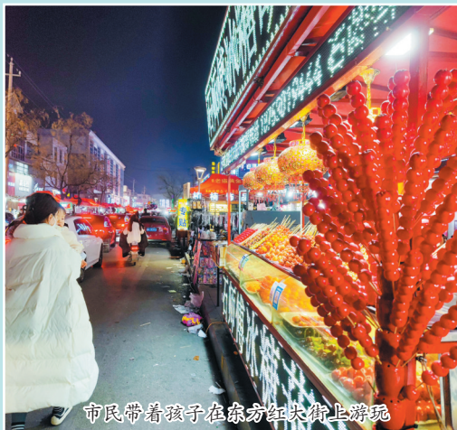
市民带着孩子在东方红大街上游玩