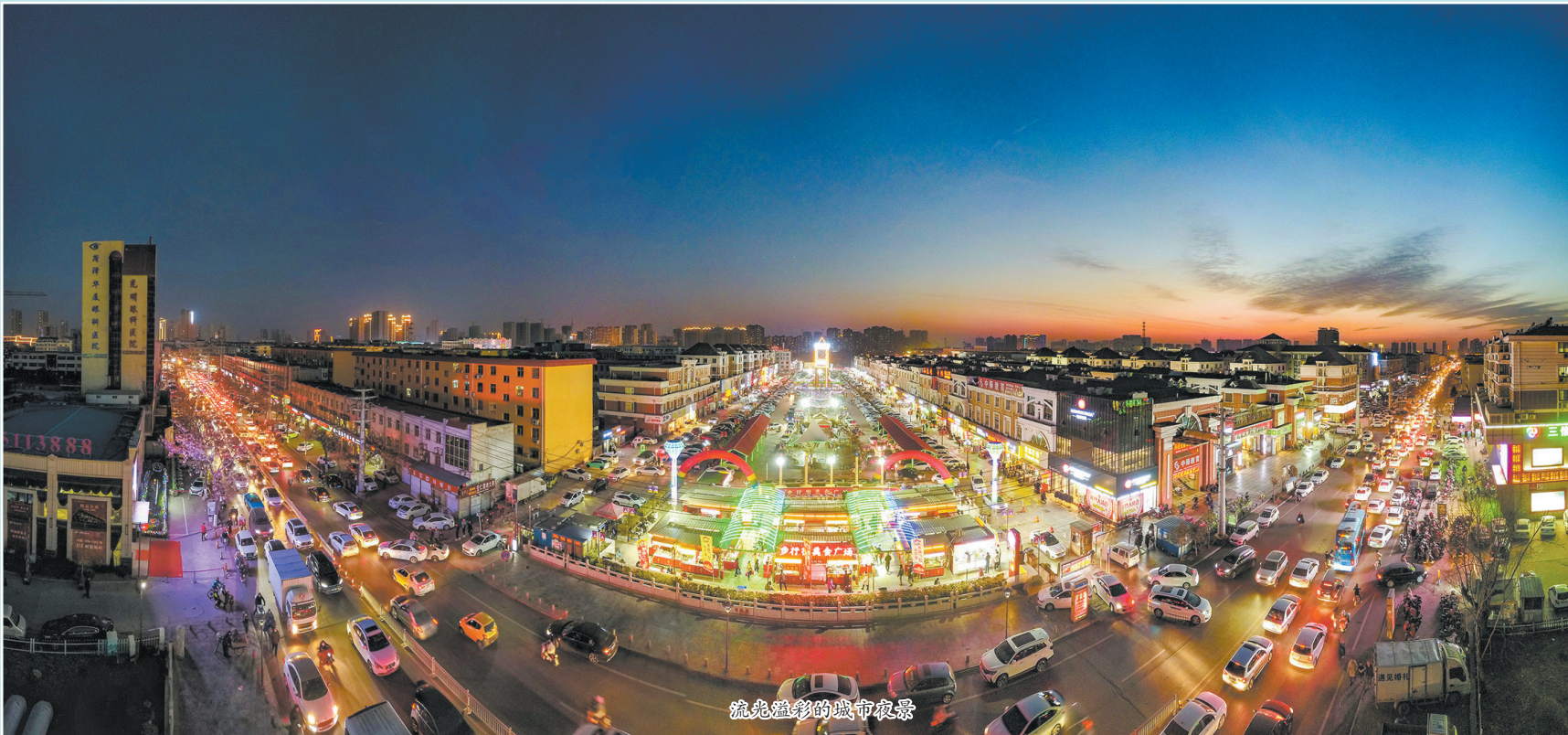
流光溢彩的城市夜景