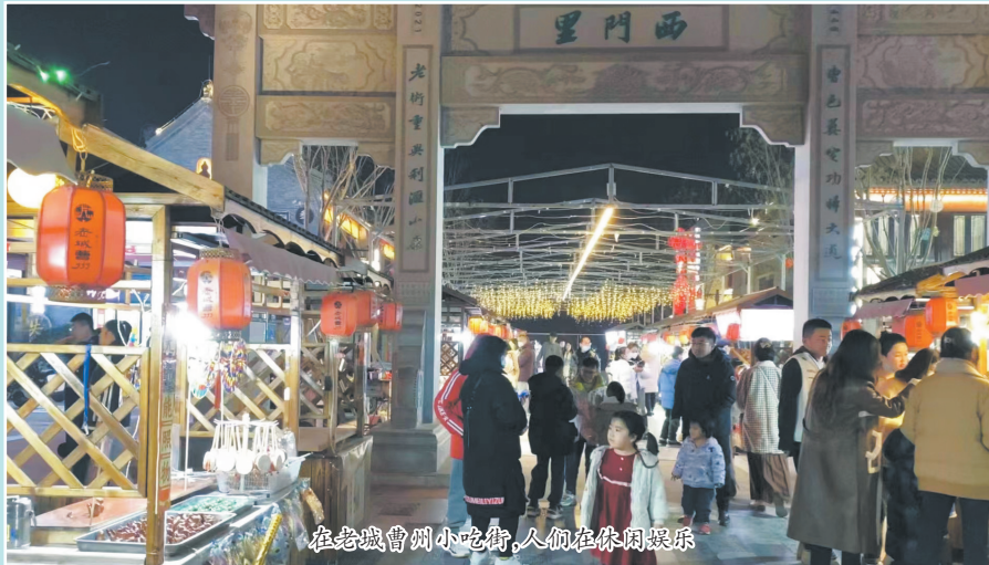
在老城曹州小吃街，人们在休闲娱乐