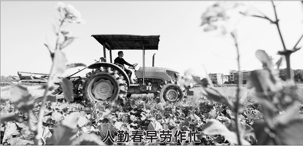
1月28日,湖南省常宁市三角塘镇江南村村民驾驶农机在翻耕农田。时下,全国各地农民积极投入农业生产之中,一派人勤春早的忙碌景象。