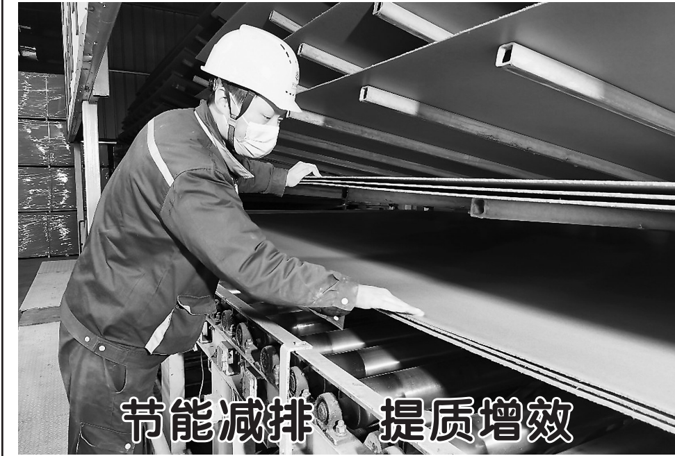
节能减排 提质增效