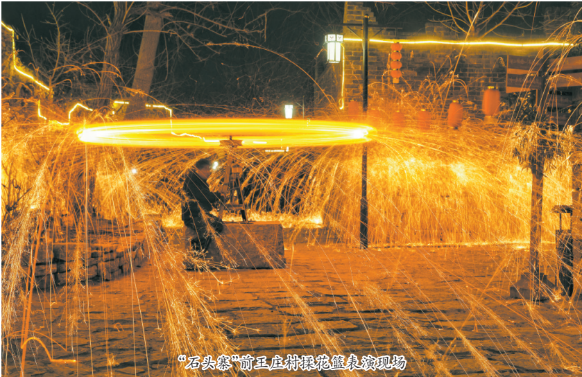
“石头寨”前王庄村揉花篮表演现场