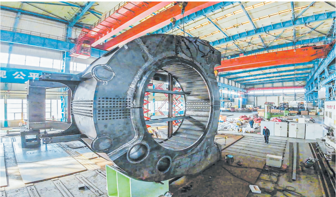
2月18日，工人在位于辽宁省沈阳市的北方重工有限公司车间吊装零部件(无人机照片)。

国家信息中心大数据发展部研究员杨道玲表示，通过分析全国100个有代表性的孵化器周边人流量数据发