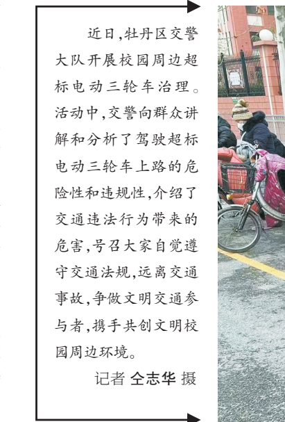
治理超标电动三轮车

近日，牡丹区交警大队开展校园周边超标电动三轮车治理。活动中，交警向群众讲解和分析了驾驶超标电动三轮车上路的危险性和违规性，介绍了交通违法行为带来的危害，号召大家自觉遵守交通法规，远离交通事故，争做文明交通参与者，携手共创文明校园周边环境。