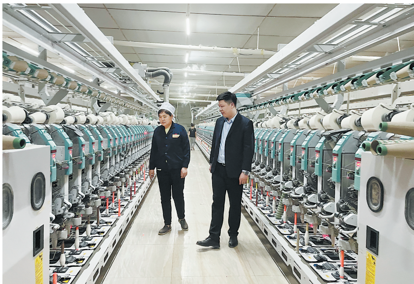
发放专项贷款，助力企业发展

为积极贯彻落实中央及行业管理部门和省联社“乡村振兴战略”，发挥农商银行网点遍布城乡的优势，郓城农商银行与各乡镇签订了“乡村振兴战略协议”，积极向政府作好汇报，制定助力乡村振兴发展规划，拉出具体工作方案，详细列出了具体的工作措施，得到了县委、县政府的充分肯定。结合郓城农村信贷的实际需求，先后推出了“宜居贷”等多种惠农产品。根据国家制定的信贷惠民政策，在服务质量、便捷