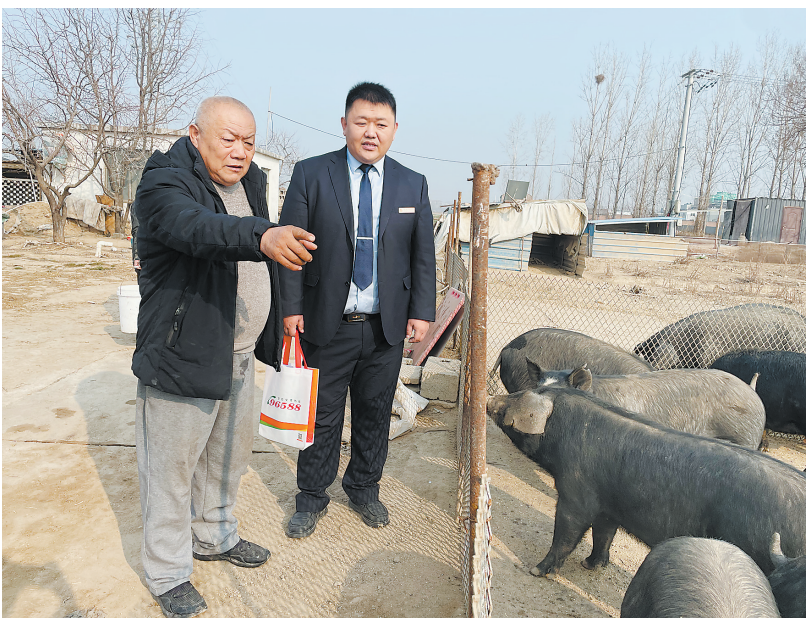
加强信贷支持，助力乡村振兴