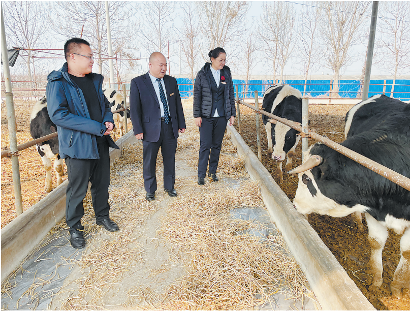
大力支持养殖业发展

同时，郓城农商银行不断加快信用环境建设，持续开展金融知识普及活动。重点选取基础金融知识、预防非法集资、防范电信诈骗等，通过悬挂宣传条幅、发放宣传折页，定期开展“送金融知识下乡”活动，不断加强网点建设，改进网点服务质量，网点有资料、手机有信息、身边有活动，提高乡村居民金融素养和诚信意识。