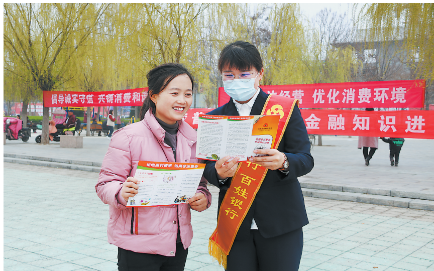
向群众宣传金融知识

“党员先锋队”“党员突击队”“红马甲冲锋在前的身影。近年来，通过厅堂服务、金融服务队”，如今，走进郓城农商银行任意一家网点和服务的辖区，都能看到他们