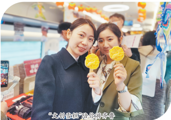
“文创雪糕”陪你游齐鲁