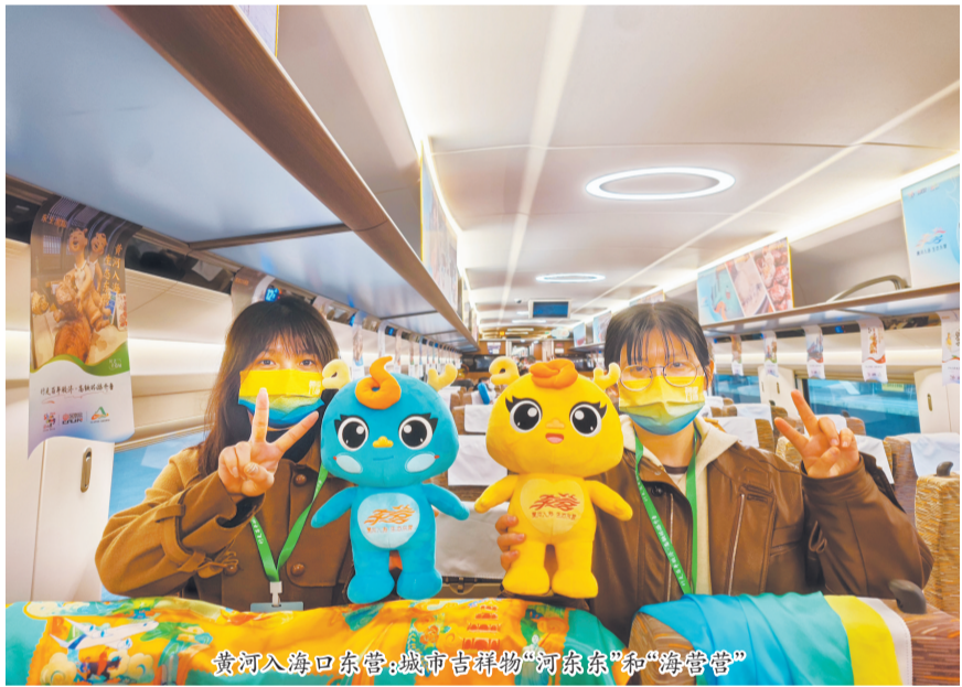
黄河入海口东营：城市吉祥物“河东东”和“海管管”