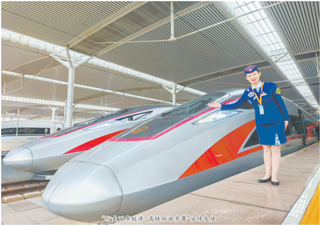
“行走百年胶济 高铁环游齐鲁”宣传大使