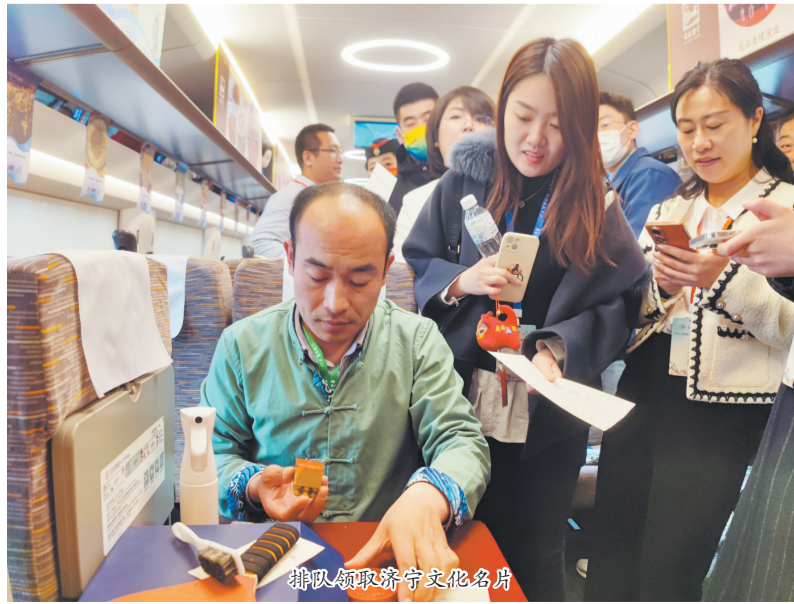
排队领取济宁文化名片