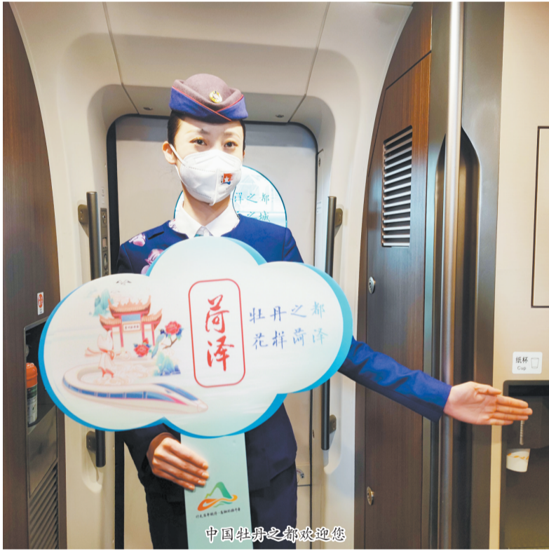
中国牡丹之都欢迎您