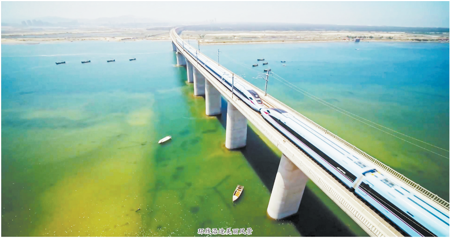
环线沿途美丽风景