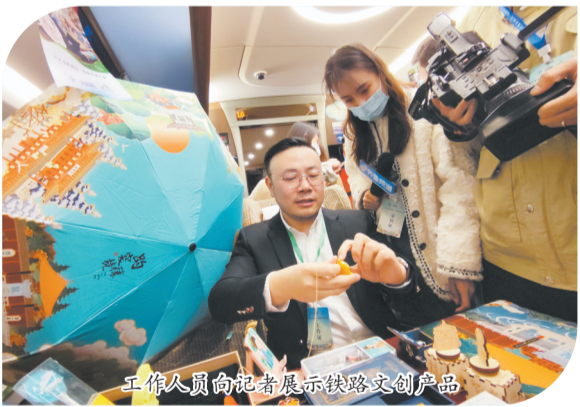
工作人员向记者展示铁路文创产品