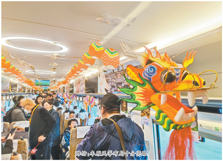
潍坊：年画风筝布局十分抢眼