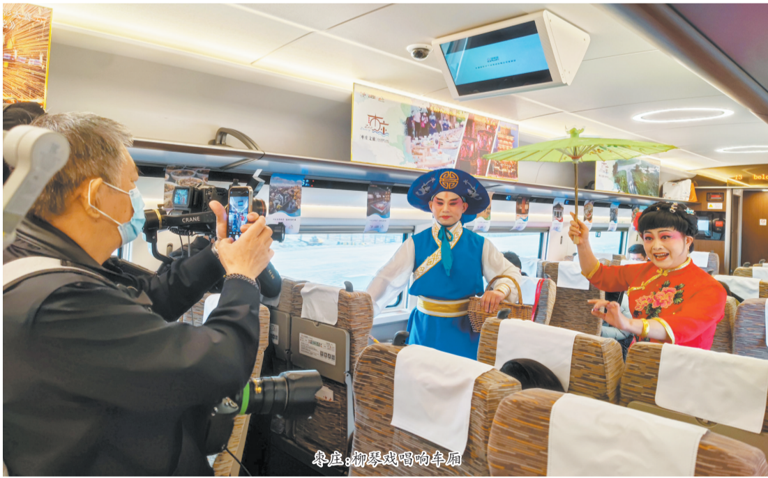
鲁剧：柳琴戏唱响车厢