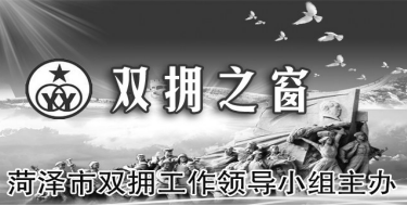
菏泽市双拥工作领导小组主办