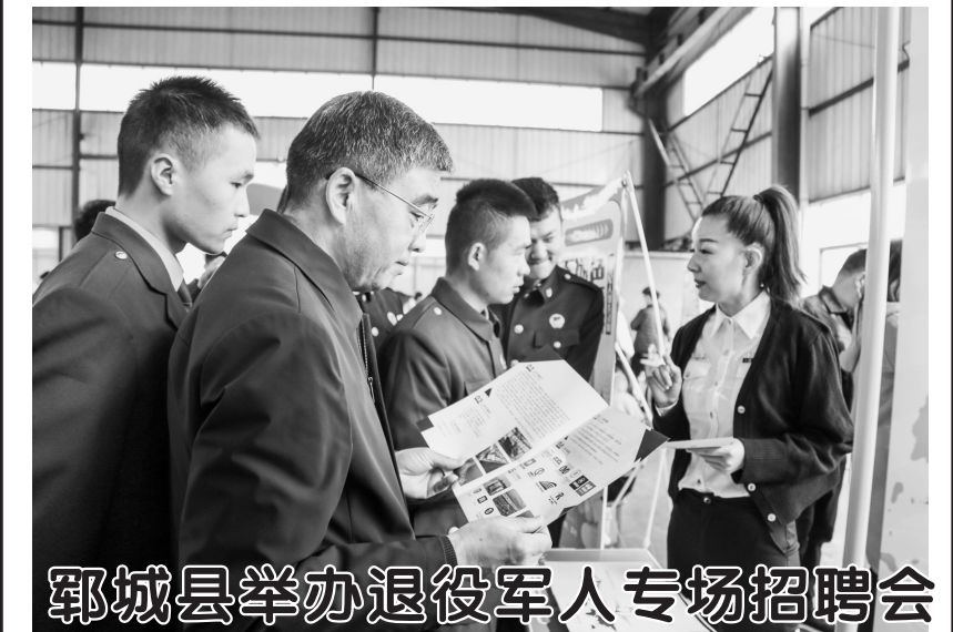
鄆城县举办退役军人专场招聘会

3月17日，鄆城县举办“全省退役军人服务省市重大项目人力资源对接系列活动”鄆城专场招聘会。本次招聘会由鄆城县退役军人事务局、县经济开发区管理委员会、县人力资源和社会保障局共同主办。活动当日，来自省内外外的36家企业向该县退役军人展开专项招聘，企业代表纷纷拿出优质岗位，供该县退役军人挑选。活动最后，86名退役军人与企业达成就业意向，并签订就业合同。