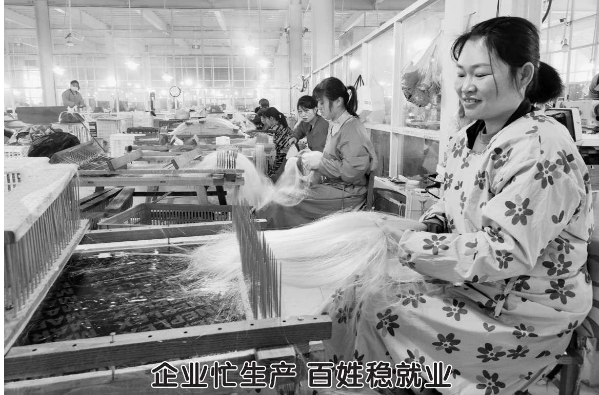
企业忙生产 百姓稳就业

近日，在位于鄆城县工业园的高泽发制品有限公司生产车间里，拉发、水洗、漂染、包装……多名工人忙着赶制国外发制品订单。记者采访了解到，该企业为我市重点镇——鄆城县都营镇招商引资企业，于2020年初正式投产，每年可加工出口欧美发制品20万套，产品款式新颖，备受市场青睐。目前企业员工达180人，在实现自身发展的同时，企业还辐射带动了附近2000余名群众从事相关行业。