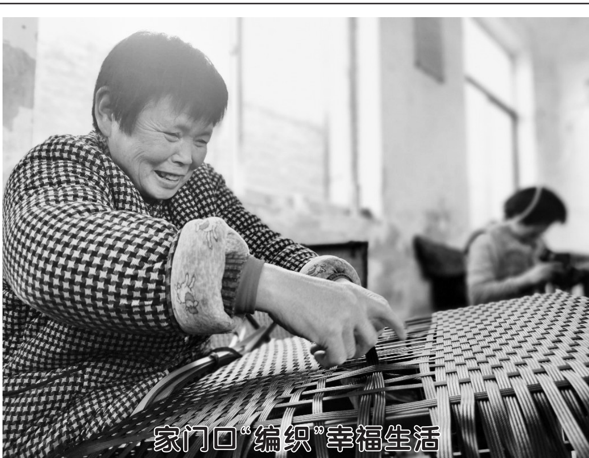
家门口“编织”幸福生活

尽管我市国资国企党建特色品牌建设有了一定的基础，但仍缺乏具有高“识别度”的党建品牌。“我们要结合产业行业企业特色，打造具有高‘身份证识别度’的党建品牌。要做到看到品牌名称就知道是什么类型的企业，主责主业是什么，甚至在形成一定影响力后，说出品牌名称就知道是哪家企业，这才是做出品牌。”司品供表示，进一步创建体现产业行业特色的党建品牌，是2023年我市国资国企系统的一项重要工作。