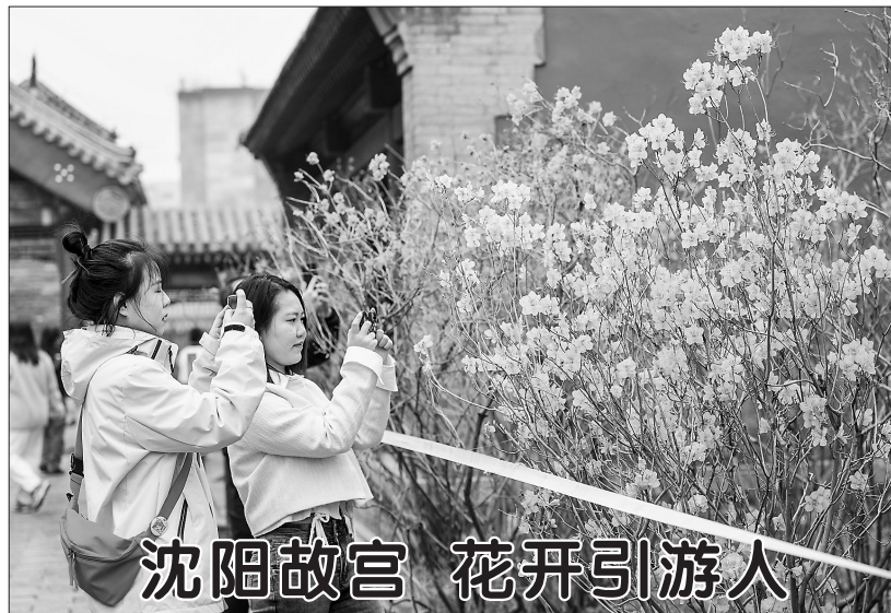
4月4日，游客在沈阳故宫赏花拍照。近日，随着气温的变化，沈阳故宫内的花卉逐渐开放，红墙花影吸引游客前来参观、拍照。

新华社北京4月4日电 中共中央总书记、国家主席、中央军委主席习近平4日上午在参加首都义务植树活动时强调，人勤春来早，植绿正当时。每年这个时候，我国从南到北渐次掀起造林绿化的热潮。今天，我们一起参加植树，就是号召大家都行动起来，既在广袤祖国大地上种下片片绿色，也在广大人民心中播撒绿色种子，共同迎接希望的春天，共同建设美丽中国。 京郊大地，春雨飘飘，春意盎然。上午10时30分许，党和国家领导人习近平、李强、赵乐际、王沪宁、蔡奇、丁薛祥、李希、韩正等集体乘车，冒雨来到位于北京市朝阳区东坝中心公园的植树点，同首都群众一起参加义务植树。