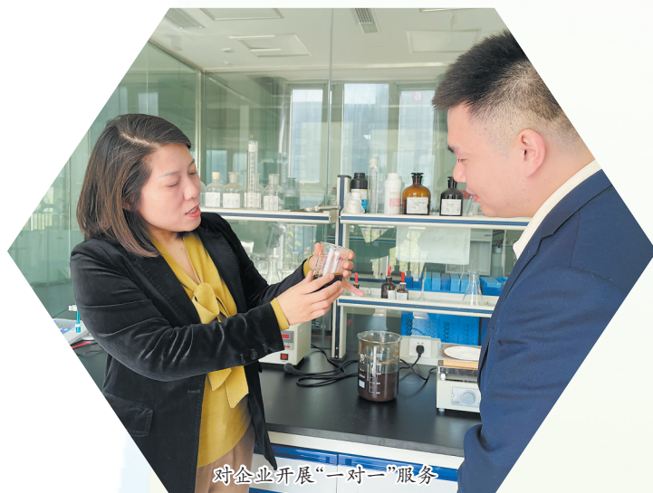
对企业开展“一对一”服务