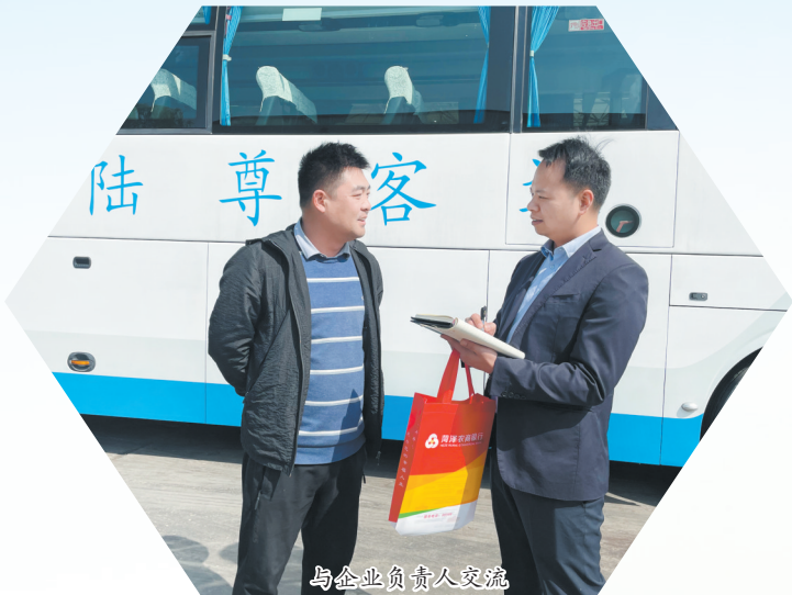
与企业负责人交流