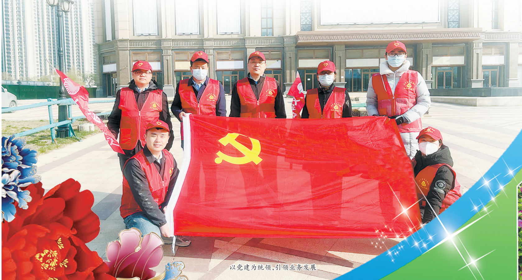
以党建为统领，引领业务发展