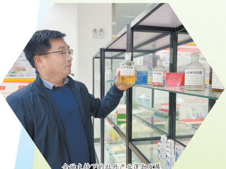
金融支持下的牡丹产业蓬勃发展