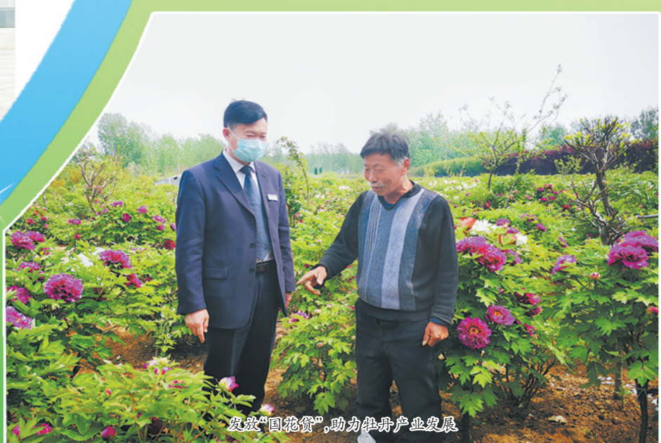
发放“国花贷”，助力牡丹产业发展