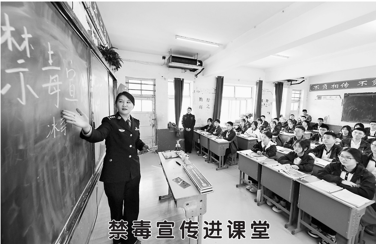
近日,曹县公安局磐石派出所组织民警深入辖区学校,开展“禁毒宣传进校园”活动。民警通过发放禁毒宣传资料和案例讲解等形式,向学生宣讲禁毒知识和毒品的危害,教育孩子们远离毒品,增强了大家的识毒、防毒、拒毒意识和能力。图为民警在曹县三桐中学向学生讲解毒品的危害。

答群众法律咨询630人次。“美好生活·民法典相伴”“有‘典’美好”“小荷说法”“湖西法语”等一批特色栏目深入人心。宪法“亮屏”、“宪法的力量我在做”专访和全市中小学生“学宪法、讲宪法”等活动,把宪法“十进”推向深入,在全社会营造了浓厚法治氛围。 突出分层分类,狠抓重点对象学法用法。组织市直4689名国家工作人员参与网上学法考试,合格率97.5%。2022年,全市共组织4万余名国家工作人员学法考试。抓住青少年这个“关键群体”,印发《贯彻落实中小学法治副校长聘任与管理办法》,加强中小学法治副校长配备。深入开展“呵护‘荷’苗”“‘未’你而来”等“法律进校园”活动,不断增强青少年学生法治意识。抓住农村居民这个“大众群体”。紧贴群众需求普法,推动各级各部门广泛开展“送法下乡”活动,通过现场咨询、走访、电话、微信