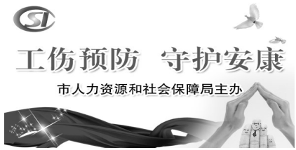
市人力资源和社会保障局主办