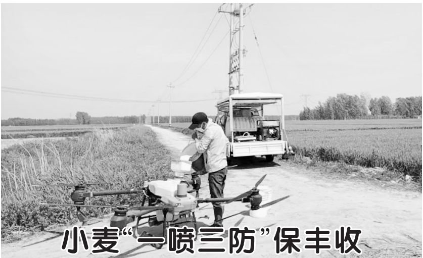
▲近日,植保无人机正在鄄城县杨庄集镇西程村开展小麦“一喷三防”飞防作业。只见无人机缓缓飞到麦田上方,机舱内的农药雾化喷出,在麦田里弥漫开来。当前,小麦陆续进入抽穗扬花期,正是产量形成的关键时期,也是条锈病、赤霉病、蚜虫等重大病虫害集中暴发危害的高发期,抓好小麦条锈病防治,对夺取夏粮丰收至关重要。杨庄集镇高度重视小麦重大病虫害防控工作,采取无人机飞防的方式,对全镇8.9万亩小麦进行“一喷三防”专业化统防统治,全力以赴“虫口夺粮”保丰收。

本报讯(记者 孙涛 通讯员 陈威)5月8日,2023年度(春季)我市自主就业退役士兵适应性培训班举行开班典礼。该活动由市退役军人事务局主办,菏泽职业学院承办。全市2023年度自主就业退役士兵260余人参加培训班,并进行为期5天的培训。 此次培训的目的是让自主就业退役士兵尽快转变思想观念、适应地方发展环境,提升履职能力和就业竞争力,为我市退役军人返乡就业创业奠定良好基础,顺利实现从部队到地方的身份、角色、职业转换,进一步服务菏泽经济建设,为推动我市高质量发展、助力“突破菏泽,鲁西崛起”作出应有贡献。 菏泽职业学院是全市退役军人职业技能培训基地,市退役军人事务局与菏泽职业学院战略合作以来,学院始终秉持校地联合理念,结合实际,科学制定退役军人培训方案,实行职业资格证书、毕业证