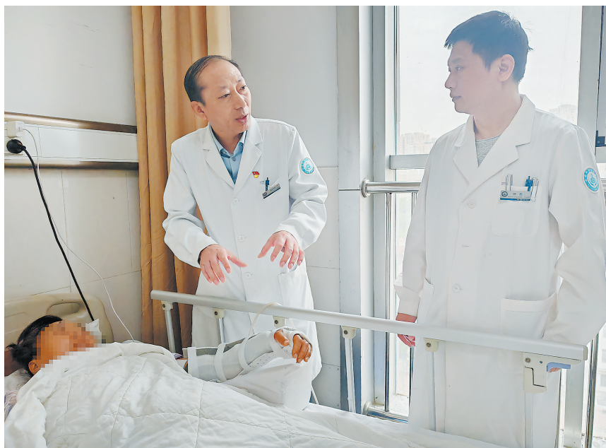
菏泽市立医院手足显微外科专家诊疗中

菏泽市立医院手足显微外科专业始建于2014年,是全市最早成立的手足显微外科。经过数年的发展,手足显微外科已形成人才梯队合理、技术先进、亚专业健全、诊疗规范精准,集治疗、手术、随访、宣教于一体的诊疗中心。科室配备有高端的仪器设备,治疗水平达到山东省省内先进、菏泽市领先水平,是菏泽市临床重点学科。目前,菏泽市立医院手足显微外科有医护人员29人,其中医师12人,主任医师1人,副主任医师1人,主治医师8人,住院医师3人,其