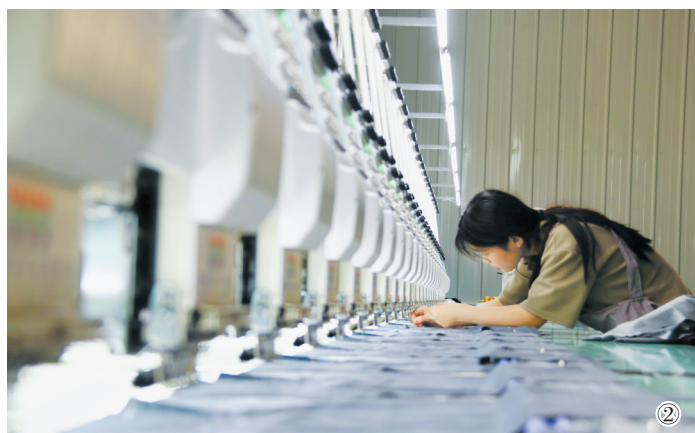
①在牡丹区黄壤镇洪达线业生产车间,工人正在自动化生产线上工作。 ②在牡丹区沙土镇鑫隆箱包公司生产车间,工作人员正在电脑刺绣生产线上忙碌。 ③在牡丹区安兴镇兴志全机械制造公司,工人正在检验挖掘机配件产品。 ④在牡丹区王浩屯镇佳钥电子科技生产车间,工人正在加工传输线。 ⑤在牡丹区吴店镇英博尔电气生产车间,工人正在检查电机主板。