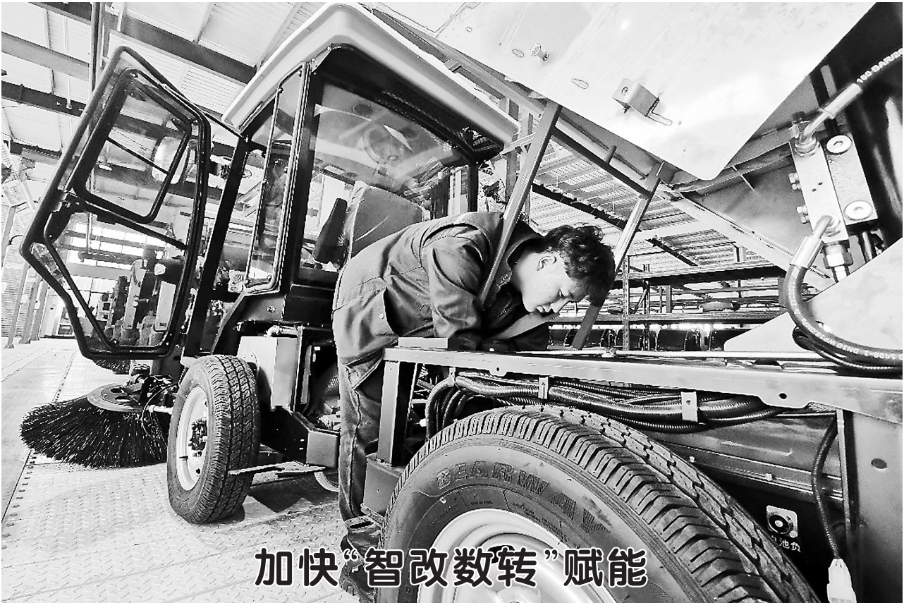
加快“智改数转”赋能

5月25日,牡丹区吴店镇华智智能装备有限公司生产车间内,工人正在检查智能扫地车。该公司通过智能化改造,首创国家环卫电动小型扫地机生产模式,年产值过亿元。据悉,今年,我市将加快推动制造业智能化改造和数字化转型,深入实施“技改提级”行动计划,实现规模以上企业技改要素供需对接县区全覆盖,推动26家企业开展智能化改造。