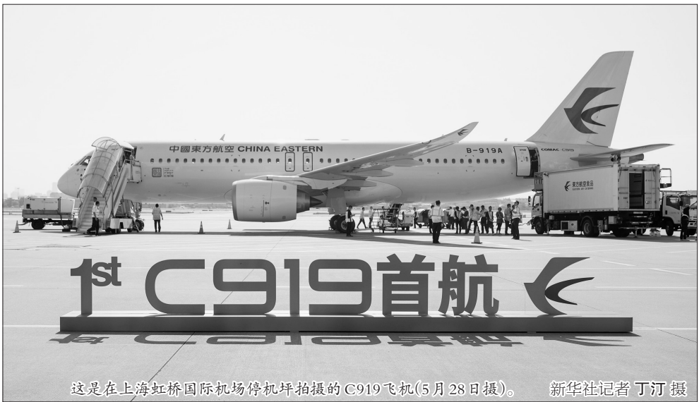
这是在上海虹桥国际机场停机坪拍摄的C919飞机(5月28日摄)。

航班号MU9191，起飞时间10点32分，登机口上海虹桥国际机场49号……记者作为国产大飞机C919商业首航的旅客开始沉浸式体验之旅。 摆渡车搭载首航旅客从登机口驶向中国商飞公司向中国东航交付的全球首架C919飞机。在行驶途中，停靠在机坪上来自各航空公司的种种机型尽收眼底。上海虹桥国际机场是我国重要的空中门户，这里服务过世界上几乎所有最先进的飞机，今天终于出现了执飞中国民航商业航班的C919的身影。 一架中国东航白色涂装的C919飞机停靠在远机位，远远望去，它的涂装和中国东航机队的其他飞机一样，但首航旅客中有不少人一眼就认出了它，“这架就是C919，它的机翼构型和其他飞机不一样！” 不少首航旅客是国产大飞机的“发烧友”。他们有的虽然从事着和飞机并不直