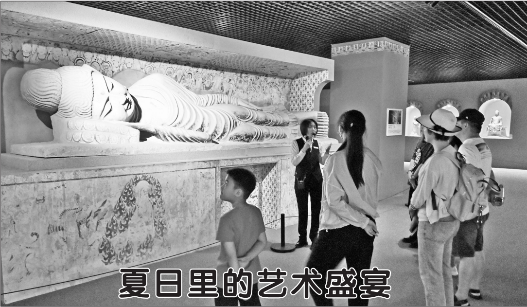
夏日里的艺术盛宴

主体责任，依法依规处置“自媒体”造谣传谣、假冒仿冒、违规营利等突出问题。截至5月22日，重点平台累计清理违规信息141.09万余条，处置违规账号92.76万余个，其中永久关闭账号6.66万余个。