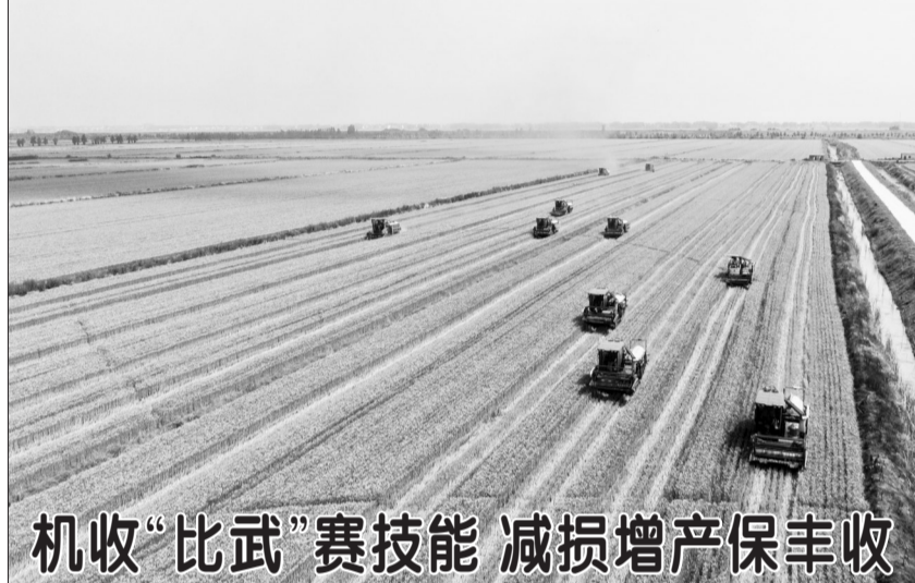
机收“比武”赛技能 减损增产保丰收

接报或发现性侵害未成年人线索后,无论是否属于本单位管辖,均要在第一时间采取制止侵害行为、保护被害人等紧急措施。(新华社北京5月31日电 记者 白阳)