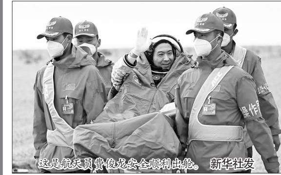
这是航天员费俊龙安全顺利出舱。

6个多月前的夜幕中,神舟十五号载人飞船由长征二号F遥十五运载火箭送入太空。4日清晨,在金色朝霞映衬下,神舟十五号载人飞船返回舱在胡杨大漠凯旋,神舟十五号航天员乘组回到地球怀抱。