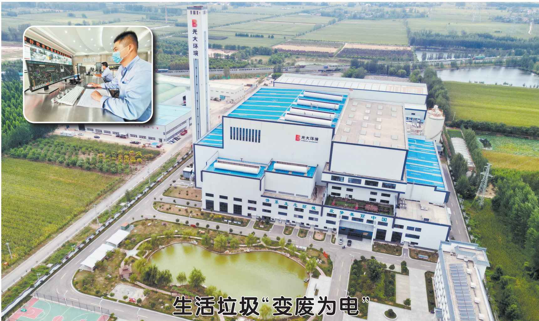
生活垃圾“变废为电”

据了解,菏泽市中医医院坚持创办让人民群众满意的医院为发展目标,打造中医有特色、西医不落后的综合医院,通过与上级医院学科共建、资源共享、平台共享,不断提升医院综合水平和服务能力,更好地满足人民群众对优质医疗服务的需求。