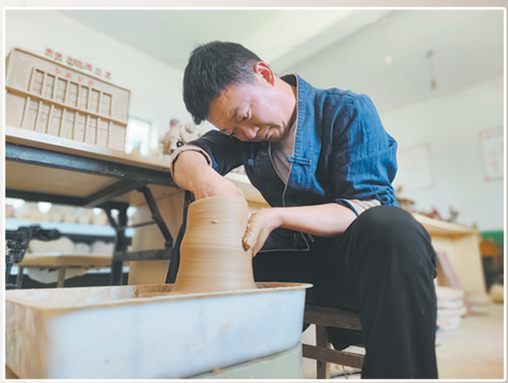
▲曹州泥偶工艺:拉坯