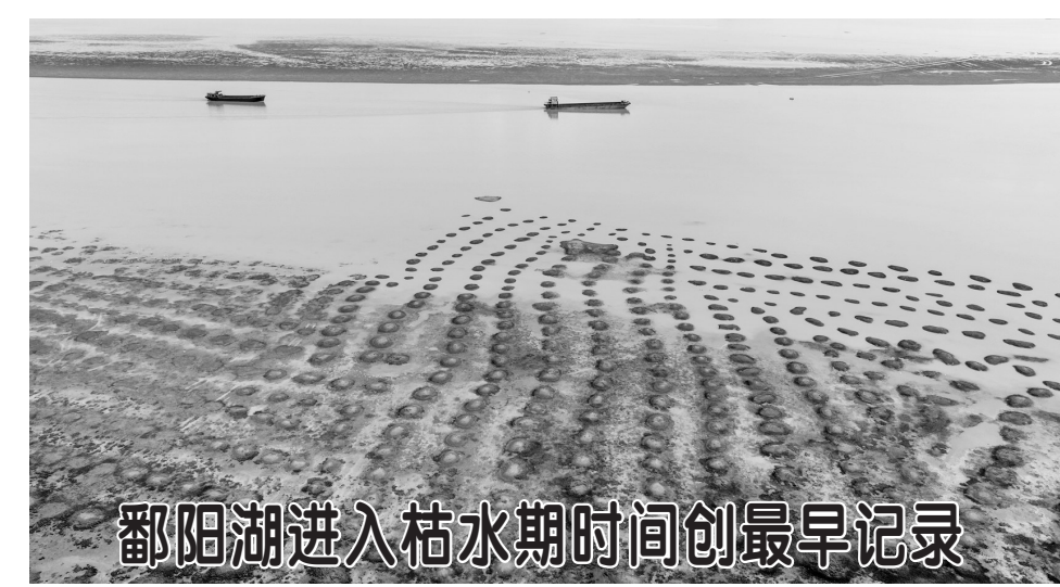
鄱阳湖进入枯水期时间创最早记录

医保局指导地方按程序将符合条件的医疗服务项目纳入医保支付范围，基本满足包括老年人在内的参保人员就医需求，并在政策上明确陪护费、护工费、洗理费等生活服务项目基本医保基金不予支付。