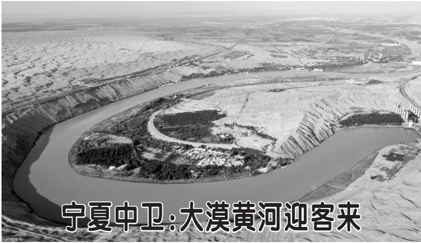
这是7月20日拍摄的位于黄河、沙漠交汇处的宁夏中卫市沙坡头景区(无人机照片)。 盛夏时节，地处黄河之畔与腾格里沙漠边缘的宁夏中卫市沙坡头景区迎来大批游客，人们在这里体验羊皮筏子漂流、沙漠冲浪、滑沙、沙漠观星等项目。据了解，进入暑期，宁夏中卫市沙坡头景区客流量大幅增长，日客流量最高超过1万人次。