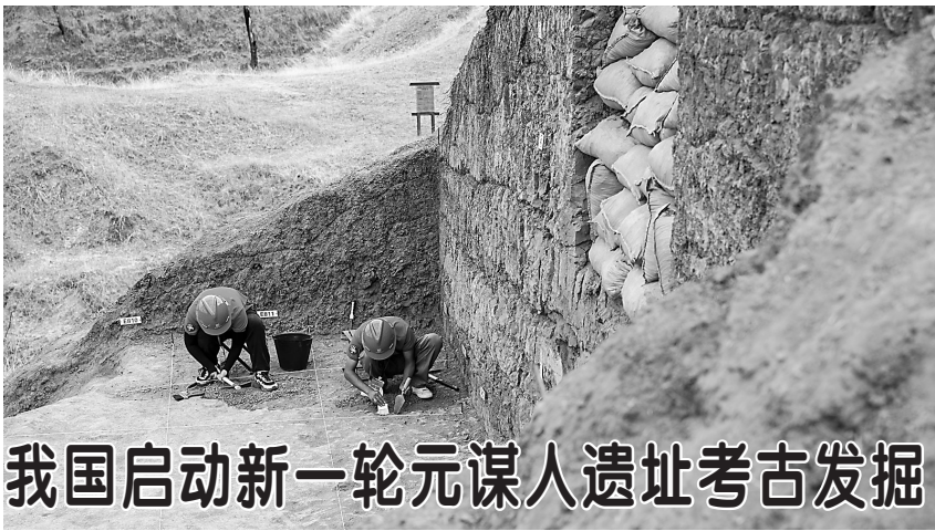
我国启动新一轮元谋人遗址考古发掘

7月21日，工作人员在元谋猿人遗址开展精细发掘。 当日，元谋猿人遗址第六次考古发掘在云南楚雄彝族自治州元谋县正式启动，80多名科研人员将系统开展遗址及周边区域的多学科综合研究，聚焦古人类学、古生物学、年代学、环境考古学等领域，探究“东方人类故乡”的更多未解之谜。