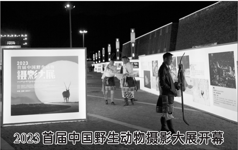
2023首届中国野生动物摄影大展开幕

各级纪检监察机关运用监督执纪“四种形态”批评教育帮助和处理纪检监察干部1.31万余人次。其中，运用第一种形态批评教育帮助1.13万余人次，运用第二种形态处理1455人次，运用第三种形态处理261人次，运用第四种形态处理123人。