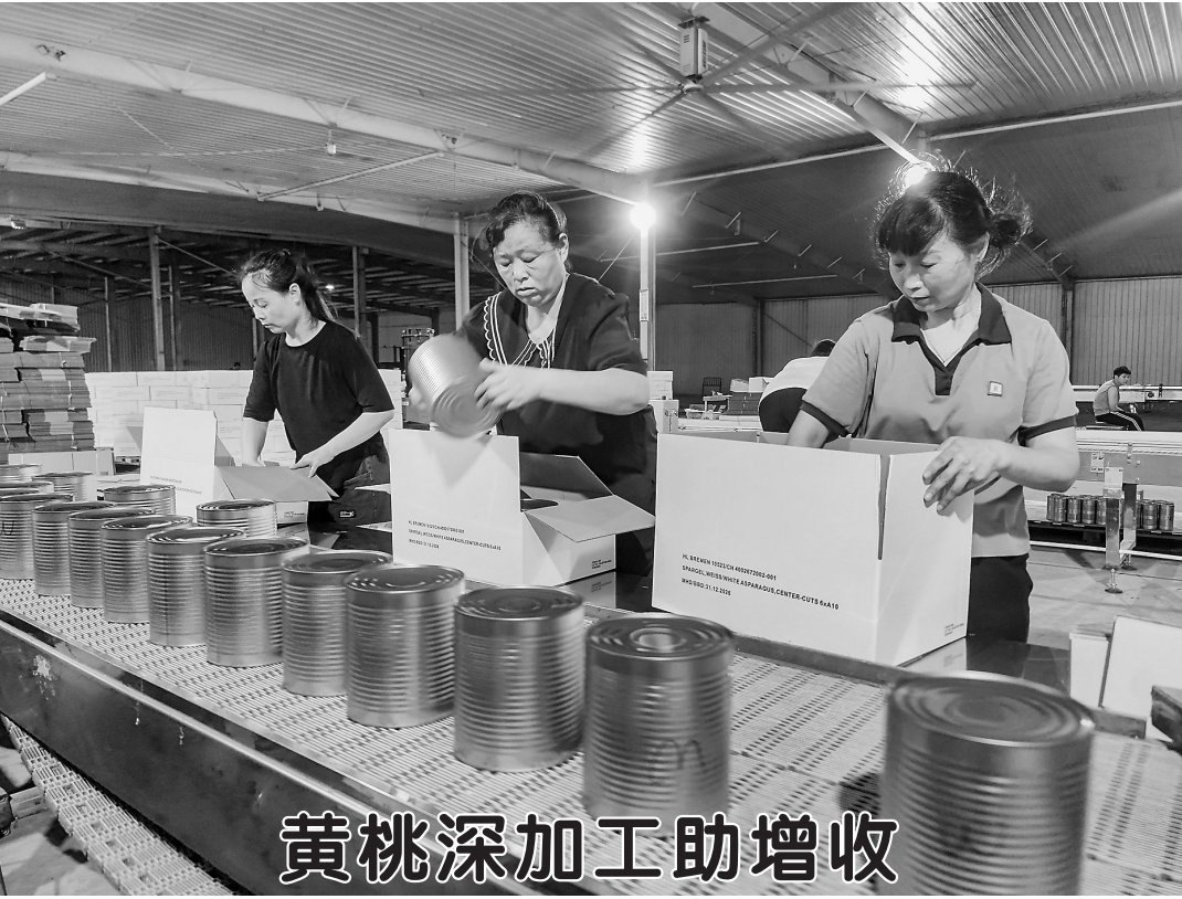
黄桃深加工助增收

▲时下正值黄桃上市旺季,8月3日,在曹县巨鑫源食品加工车间,工人在黄桃深加工生产线上忙着包装、发货。近年来,曹县多个乡镇采取“龙头企业+合作社+农户”的方式,大力发展黄桃深加工产业,年生产黄桃罐头1.2万余吨,帮助农民增收,助力乡村振兴。