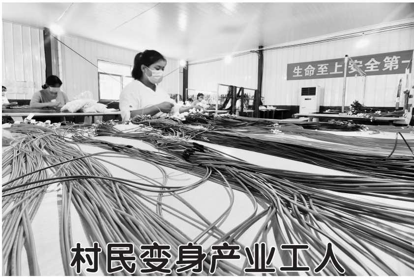
村民变身产业工人

▲时下正值黄桃上市旺季,8月3日,在曹县巨鑫源食品加工车间,工人在黄桃深加工生产线上忙着包装、发货。近年来,曹县多个乡镇采取“龙头企业+合作社+农户”的方式,大力发展黄桃深加工产业,年生产黄桃罐头1.2万余吨,帮助农民增收,助力乡村振兴。