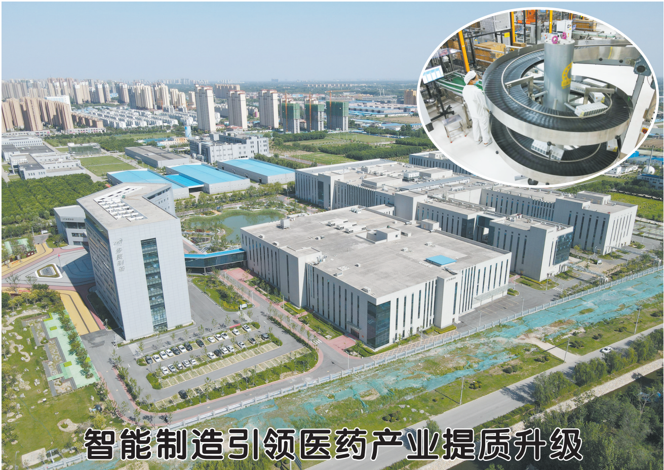
智能制造引领医药产业提质升级

世界牡丹大会是由山东省人民政府主办、菏泽市人民政府承办的国际性牡丹行业盛会,大会以“让牡丹为人类带来健康和美丽”为宗旨,旨在展示全球牡丹领域最新成果、深度开发牡丹资源,推动经济文化交流合作。世界牡丹大会自2019年已在菏泽成功举办五届,国际知名人士、诺贝尔奖获得者、院士、国内外牡丹领域的权威学者、企业精英应邀参会。世界牡丹大会已成为学术交流、品牌打造、招商引资、合作共赢的重要国际平台,有力推进了牡丹产业精准化、品牌化、国际化发展。