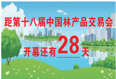
距第十八届中国林产品交易会 开幕还有28天