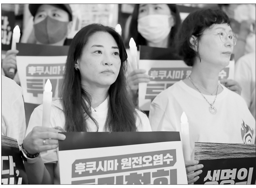
韩国民众集会抗议日本政府决定启动核污染水排海

据新华社曼谷8月23日电 泰国国会副主席蓬佩22日宣布,为泰党提名的总理候选人赛塔·他威信在当天举行的上下两院联席会议投票中获得过半数议员支持,当选新一任泰国总理。 作为唯一获提名的总理候选人,赛塔在参加投票的728名议员中获得482票支持。赛塔此前在社交媒体上表示,其从政目标是解决贫困与不平等问题,帮助泰国发展经济,为人民创造更好的生活。