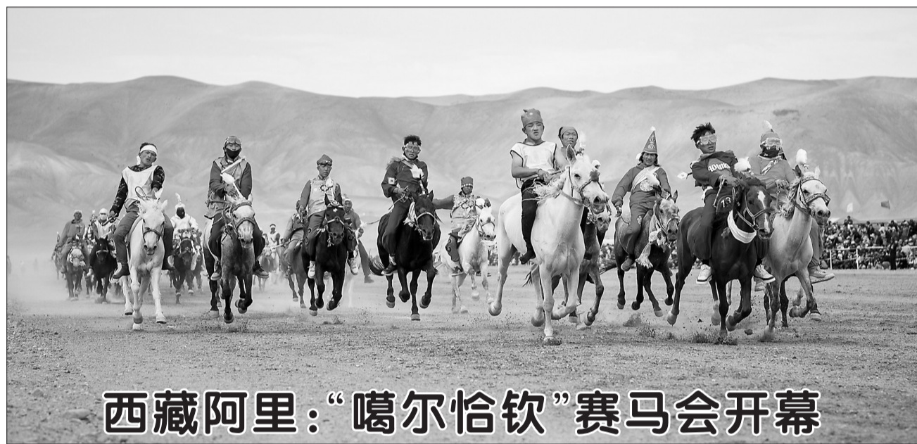
西藏阿里:“噶尔恰钦”赛马会开幕

新华社北京8月22日电(记者樊曦)记者从中国国家铁路集团有限公司获悉,自22日起,铁路部门进一步优化完善12306旅客信息服务功能,提供覆盖购票、乘车、退票改签、停运通知、晚点提示等出行信息服务,更好地满足旅客信息服务需求,提升出行体验。 据国铁集团客运部负责人介绍,国铁集团着力为群众办实事,切实解决旅客群众最关心最直接最现实的问题,经过深入调查研究,积极推动铁路12306系统研发升级。 优化后的信息服务功能有:在原来向旅客推送购票、退票、改签、列车停运及恢复信息的基础上,新增推送候补方向增开临时旅客列车、晚点提示、检票地点变更等信息;在原来仅向购票人推送服务信息的基础上,增加向乘车人推送服务信息;根据旅客需求,通过微信、支付宝及12306手机APP推送消息,对未开启微信及支付宝消息通知的旅客,将通过手机短信推送服务信息。