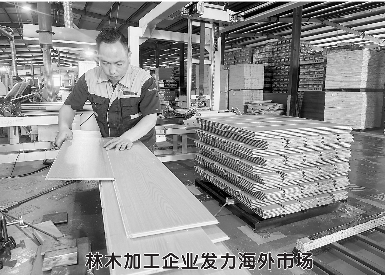
林木加工企业发力海外市场

作品不仅可以装饰墙面，还能通过视觉的震撼力，传递乡村振兴的理念，激发人们对乡村发展的关注和热情。” 东张庄村街头的变化，就像是一部精彩纷呈的电影，让人不自觉地沉浸其中，感受生活的美好。 街头公园也是东张庄村的一大亮点，该村年初根据“公园+运动健身、公园+科普教育、公园+乡村文化”的理念，打造了乡村公园2处，景观节点6处，提升了乡村生活品质，展示了新时代村容村貌。 如今的东张庄村，产业兴旺、生态宜居、乡风文明、生活富裕。一墙一文化，一墙一风景，东张庄村美出了新高度。 记者 刘志华