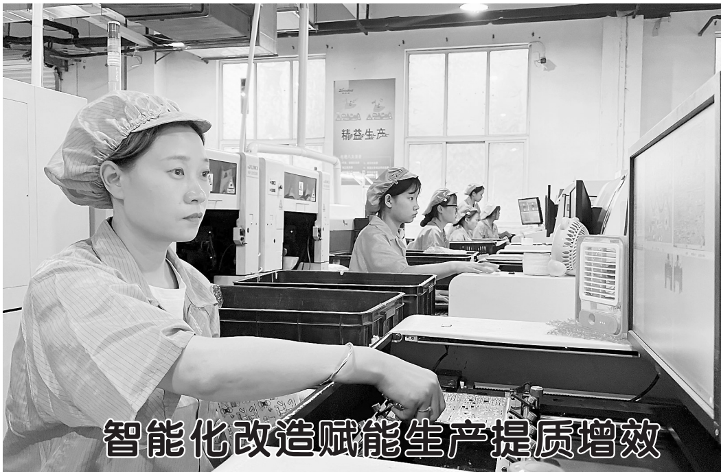
智能化改造赋能生产提质增效

▲8月31日，在位于单县经济技术开发区的山东维彩家居科技有限公司的生产车间内，工人正在进行质检工作。据悉，该公司占地100余亩，总投资1.2亿元，现有员工100余人，目前拥有强化木地板、三层实木地板两大系列，产品远销国外，是中国最大的木地板生产厂家之一。近年来，随着林木加工产业发展，单县打造特色化、专业化林产品深加工基地，大力支持林木加工企业开拓国际市场，外向型企业出口额不断攀升。