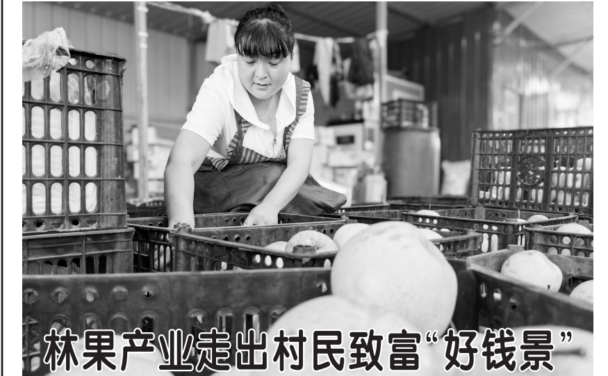
林果产业走出村民致富“好钱景”

9月5日，牡丹区小留镇梨高庄村皇冠梨种植基地，果农正在分拣刚采摘的皇冠梨。近年来，当地政府充分利用土壤、气候特点，发展特色林果产业，不仅加快了土地、资金、技术、劳动力等生产要素的合理流动和优化组合，促进农村土地有序流转，还培育出一批农业新型生产经营主体，催生了“合作社+基地+农户”的生产模式，有效带动当地群众就业增收。