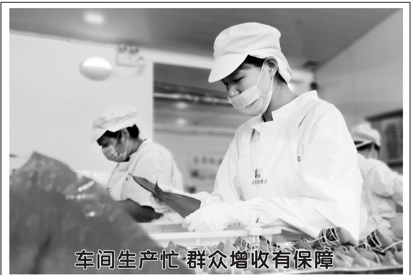
车间生产忙 群众增收有保障

开展网格化“地毯式”宣传。专项行动开展以来，全市对企业项目经理和劳资专管员开展线上劳动保障法律法规业务培训18场次，进企业、进施工现场宣传、讲解劳动保障法律法规34场次，发放政策指引2万余份，惠及农民工1.8万余人。