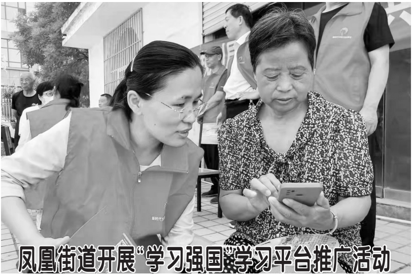
凤凰街道开展“学习强国”学习平台推广活动

本报讯（记者 王燕 通讯员 吉文选 李冲）作为三类村提升计划中的“强基村”，鲁西新区佃户屯街道虎头李村坚持党建引领，从源头细规划、精实施，创新网格治理方式，围绕“一主三支”将412户村民分为6个网格片区，构建“村党支部+党小组+网格员+户”的扁平化管理体系，从小处着手、细微处着眼，形成“集体联动、握指成拳”的工作合力。 统筹力量，织好治理“质量网”。为保证网格力量，虎头李村全面进行村级事务需求摸底，优先设立群众急需的网格岗位。通过政策宣讲，将岗位与人员进行精准匹配，确保网格员人岗合适。同时加强岗位审查，循规审批，对网格员的筛选精细化、严格化、制度化，严守“入门关”。虎头李村严格按照公告发布、资格审查、公开公示、签署合同等程序选聘网格员，从根本上杜绝“一人多岗”“家属岗”“冒名岗”等现象的出现。目前在职网格员25人，涵盖了“两委”班子成员、公益岗人员和部