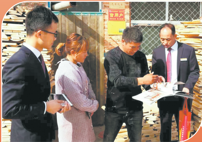
为木制品加工户提供信贷支持(资料片)