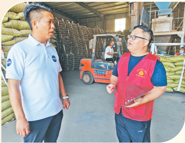
大力支持清洁能源企业生产