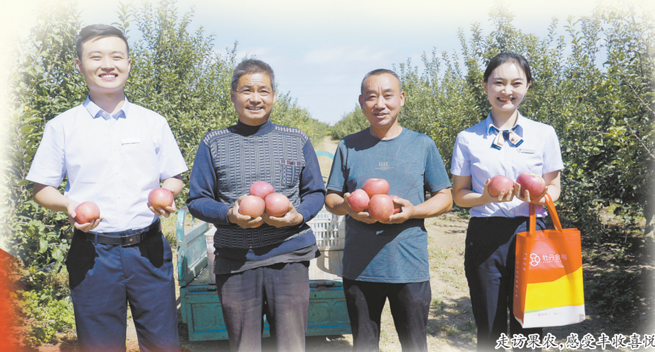
走访惠农,感受丰收喜悦