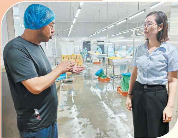
走访果品加工企业