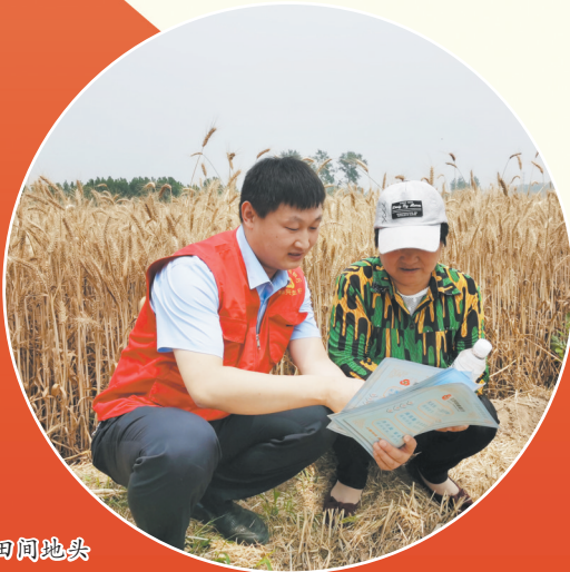
送服务到田间地头

款、结算、代发工资、理财、咨询等综合性服务,根据行业客户经营和需求特点,设计配套金融产品,提升优质客户忠诚度和贡献度;充分把握行业客户长尾效应,树立“小利润大市场”营销理念,建立起客户系统化营销体系。对存量的行业客户营销全覆盖,建立完善的行业客户信息档案,形成一条动态、健康的行业客户营销链。 大道至简,实干为要。“菏泽农商银行将继续主动融入经济发展大局,压实政治责任,强化党建引领,落实政策支持,持续拓展金融服务乡村振兴和实体经济的广度和深度,为全市经济社会高质量发展展现更大作为、作出更大贡献。”菏泽农商银行党委书记时伟表示。 文/图记者 杨飞 通讯员 鹿升 徐敏