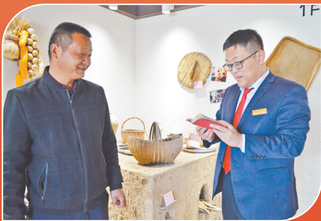
开展“整村授信”工作(资料片)