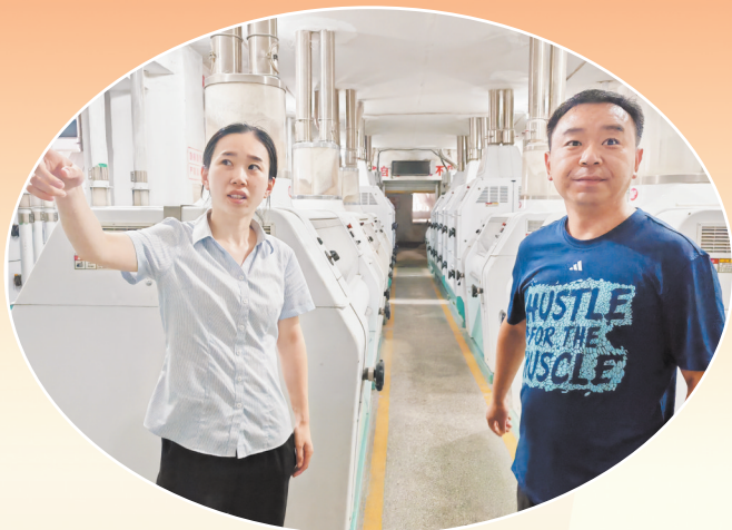
为企业注入“金融活水”